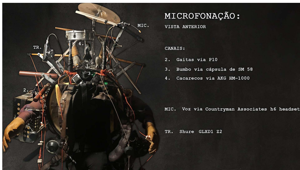
Figura 2 (Edição de Imagem: Vick Albali)