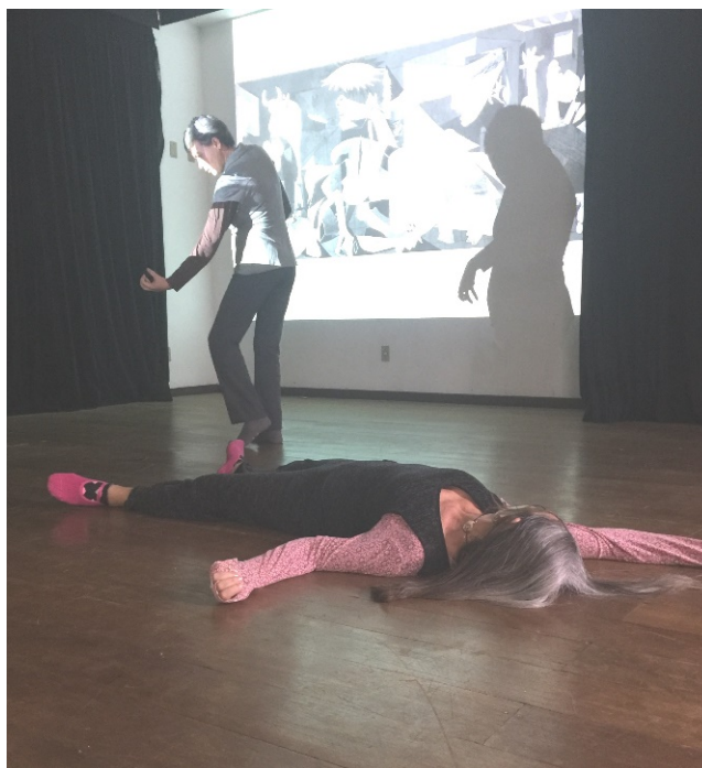
Vídeo 1 – O enquanto da ação

Fonte: Acervo pessoal do pesquisador (18/09/19) https://www.youtube.com/watch?v=siAj6nhjUe4