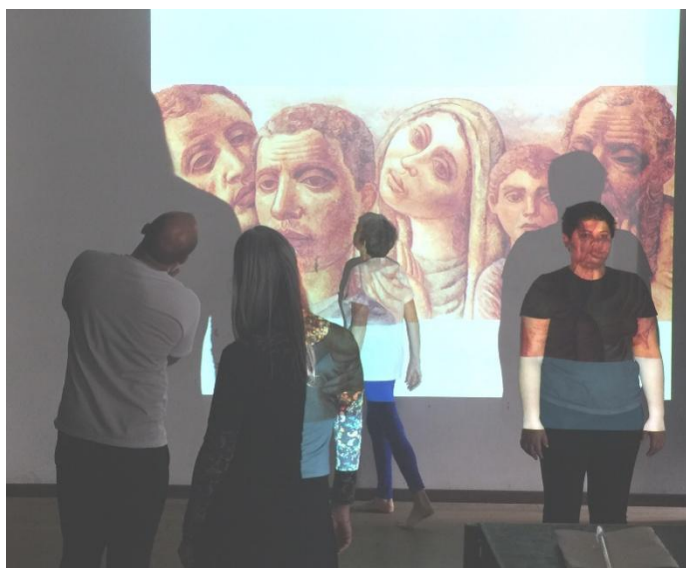
Figura 1 – O que eu vejo-sinto sob os olhos que me olham

Fonte: acervo pessoal do pesquisador, 4/09/2018