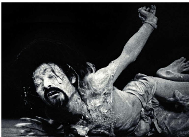
Figura 3: Hijikata no espetáculo Hosotan , 1972, imagem disponível em https://www.damianofina.it/en/tatsumi-hijikata-founds-butoh-dance-for-a-revolution-of-the-body/

A questão micropolítica – ou seja, a questão de uma analítica das formações do desejo no campo social – diz respeito ao modo como se cruza o nível das diferenças sociais mais amplas (que chamei de “molar”), com aquele que chamei de “molecular”. Entre esses dois níveis, não há uma oposição distintiva que dependa de um princípio lógico de contradição. Parece difícil, mas é preciso simplesmente mudar a lógica. Na física quântica, por exemplo, foi necessário que um dia os físicos admitissem que a matéria é corpuscular e ondulatória, ao mesmo tempo. Da mesma forma, as lutas sociais são, ao mesmo tempo, molares e moleculares... (GUATTARI; ROLNIK, 1986, p. 127)