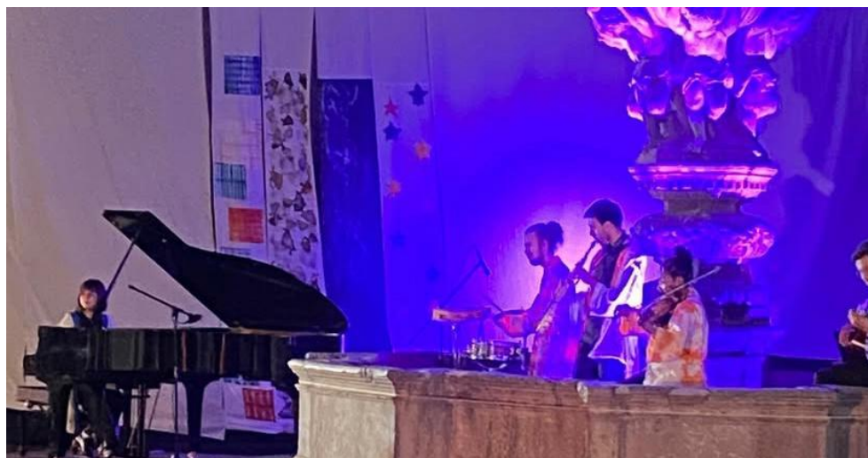
Figura 5: Call/ Convocatória – Performance apresentada no Largo do Paço, Braga, Portugal.