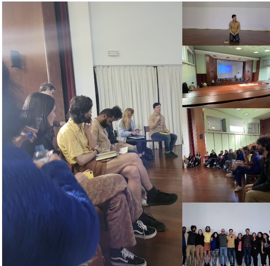
Figura 1: Palestras sobre o Projeto Atuar no Mundo - Universidade de Lisboa, Portugal.

'ação' e 'atuação' nos termos elaborados no projeto, propus para o segundo encontro a possibilidade das pessoas participantes produzirem, a partir de instruções específicas, um primeiro esboço de ações, seja no auditório onde estávamos ou em suas imediações. Desses encontros, para além da transformação sensível ocorrida no auditório, permanecem sobretudo as perguntas surgidas após o compartilhamento das ações: como perceber e intensificar a dimensão relacional dessas ações? Como cultivar as percepções que emergem da processualidade de nossos modos de subjetivação? A busca aqui foi a de criar condições que pudessem dissolver, de uma maneira diferente de como muitas vezes acontece nas 'palestras-performances', a separação entre reflexão e criação.