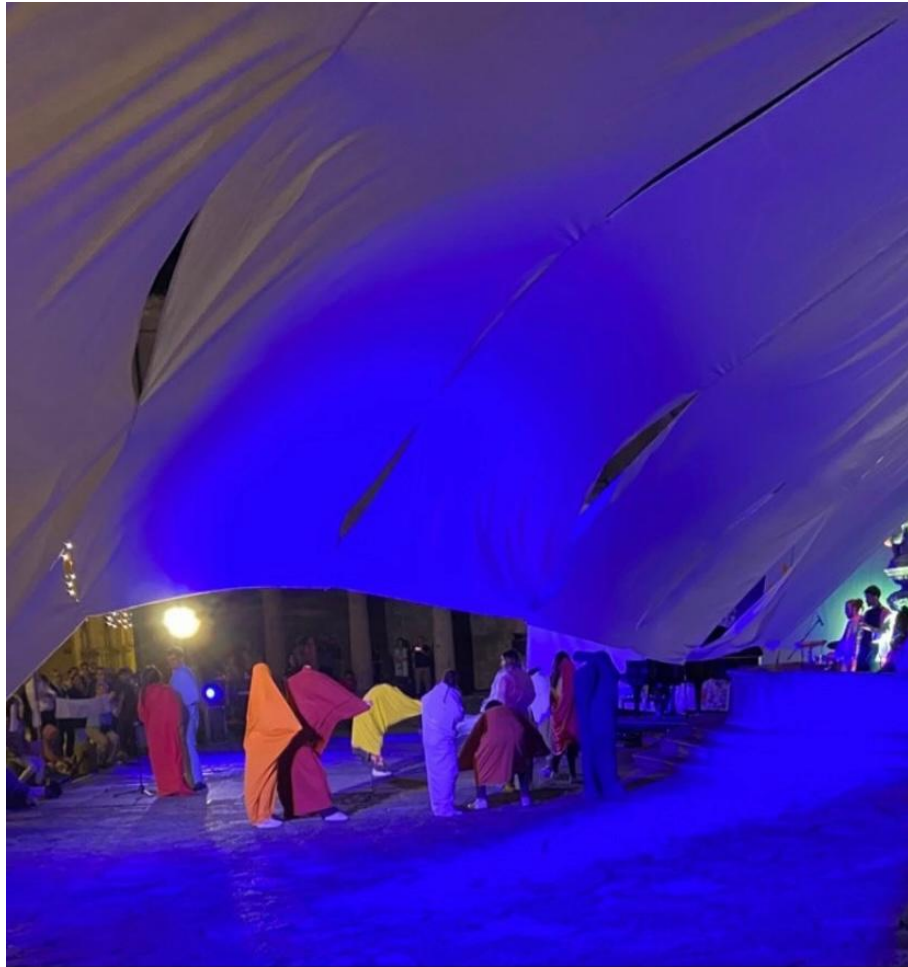
Figura 4: Call/ Convocatória – Performance apresentada no Largo do Paço, Braga, Portugal.