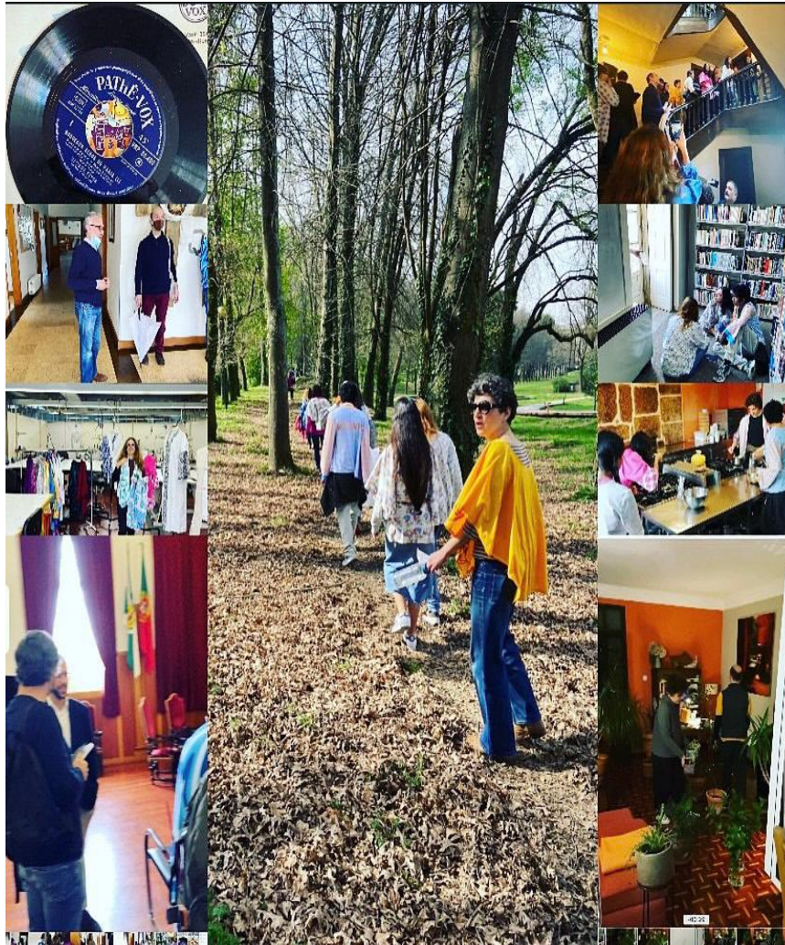
Figura 3: Displace Us/ Des-lo-car-mo-nos Performance apresentada no Festival “The Walking Body”- Guimarães, Portugal.