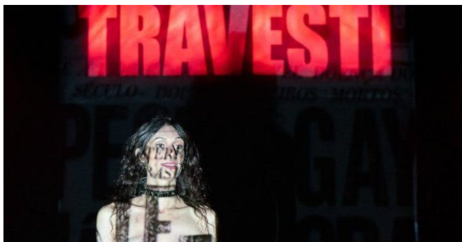
Figura 2. Cena inicial do espetáculo Manifesto Transpofágico .

Eu estou aqui para desabafar sobre o cansaço que é ser. Às vezes eu gostaria de sair de mim, só para saber como é viver sem ser constantemente olhada, observada, comentada, apontada, achincalhada, sem escutar xingamentos, risos, piadas, expulsões, pedradas... Não incomodar também incomoda quando se é travesti.