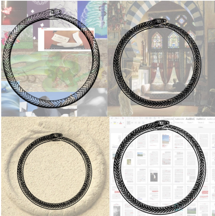
Figura 1 – Montagem com imagens da pesquisa