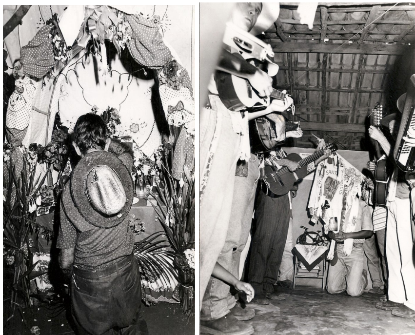
Ribeirãozinho/MT, dezembro/1995.