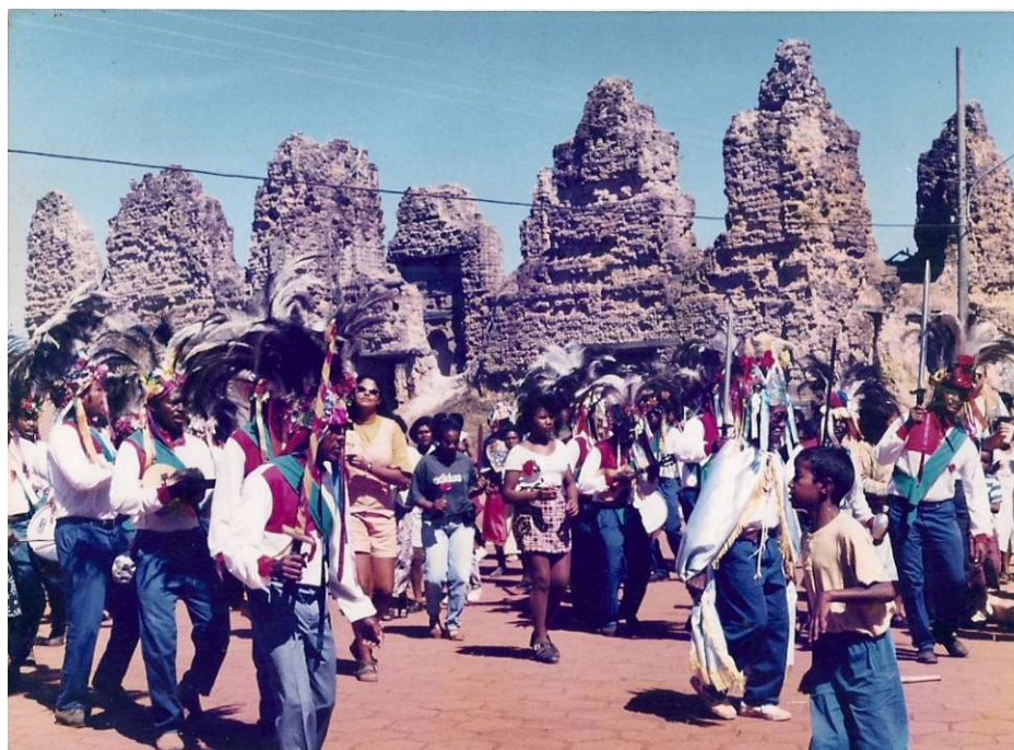
Figura 5. Dança do Congo à frente das ruínas da antiga Igreja.

Vila Bela da Santíssima Trindade/MT, julho/1995.