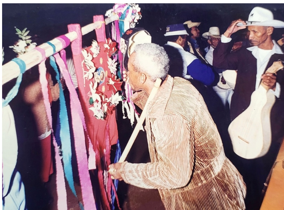
Figura 1. Cururueiros saúdam a bandeira de São João.

Cuiabá/MT, junho/1996.