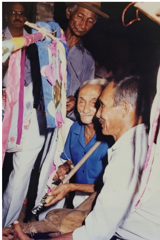
Cáceres/MT, janeiro de 1996.

Revista Moringa Artes do Espetáculo, João Pessoa, UFPB, v. 17 n. 1, jan-un 2026