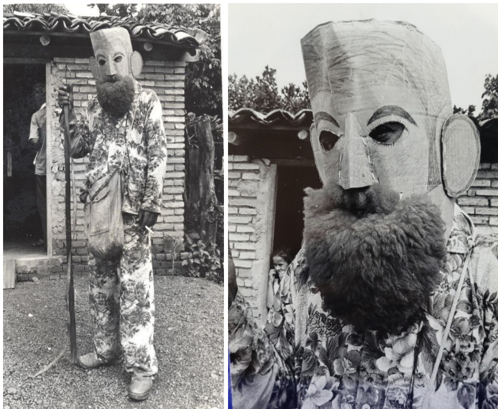
Ribeirãozinho/MT, dezembro/1995.

Os foliões agradecem, festando e dançando, nas casas em que são recebidos com comidas e bebidas, em seu giro com a bandeira da Folia de Reis.