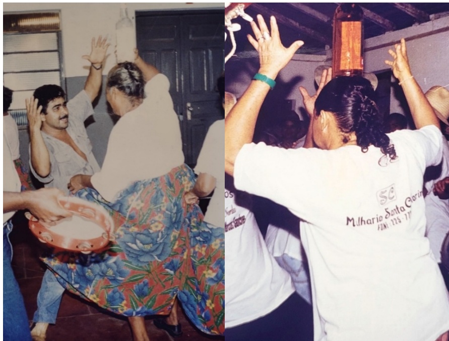
Figuras 12 e 13. Mulheres e homens da Folia de Reis de Araguaiana dançam, agradecendo a bebida e comida em uma casa que os recebeu com farta refeição.

Fonte: Acervo da pesquisadora. Araguaiana/MT, novembro/1995.