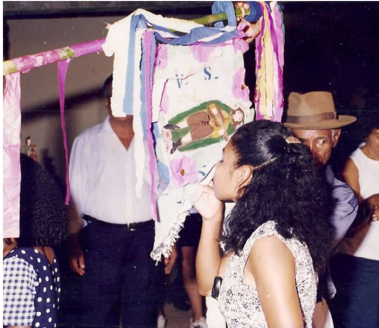
Barra do Bugres/MT, maio de 1996.