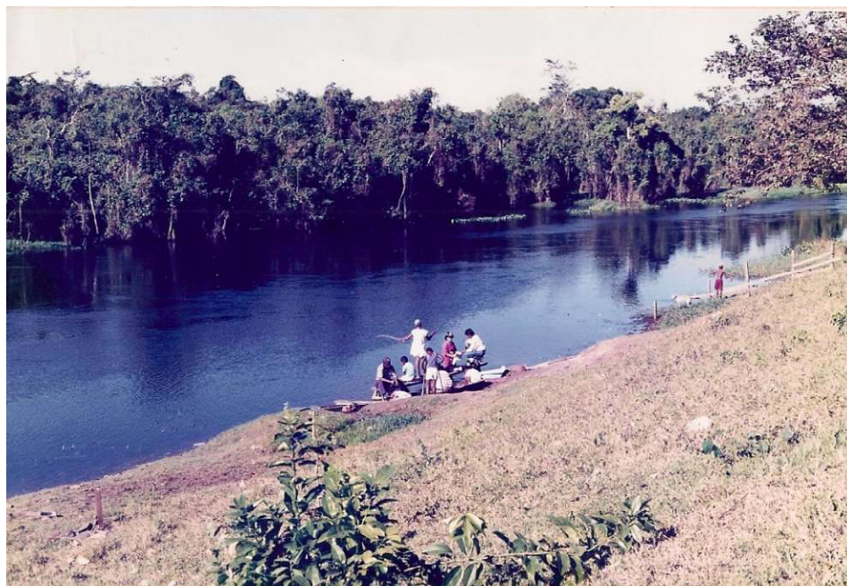
Figura 4. Rio Guaporé, família pescando.

Vila Bela da Santíssima Trindade/MT, julho/1995.