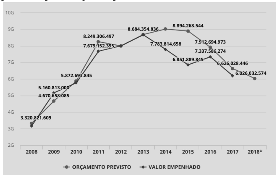
Figura 1 – Repasses do governo para as universidades federais