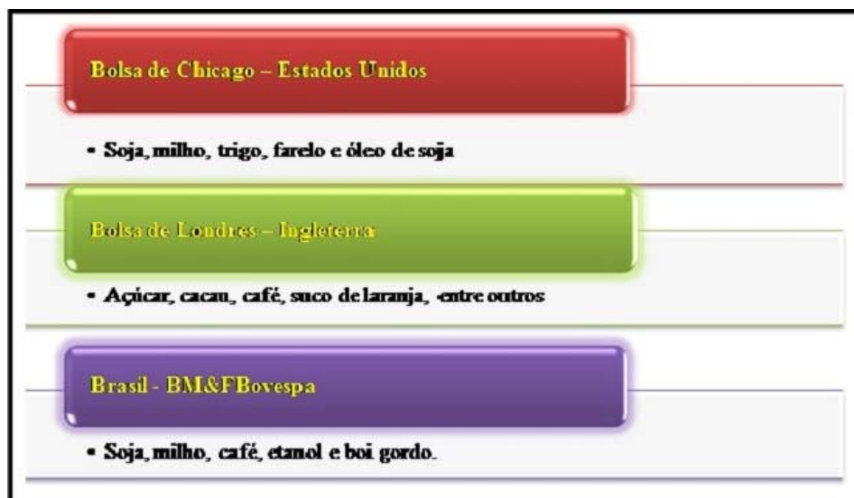
Figura 1. Principais Commodities negociadas nas Bolsas de Mercadorias e de Futuro em escala mundial.

Fonte: OLIVEIRA, Ariovaldo Umbelino de. Disponível em: