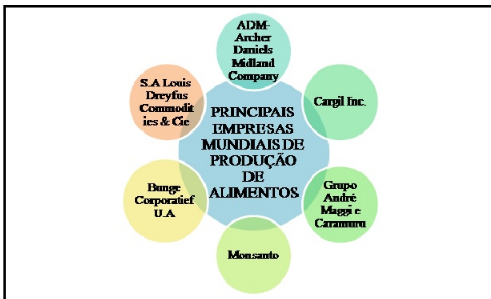
Figura 2. Principais empresas mundiais produtoras de grãos