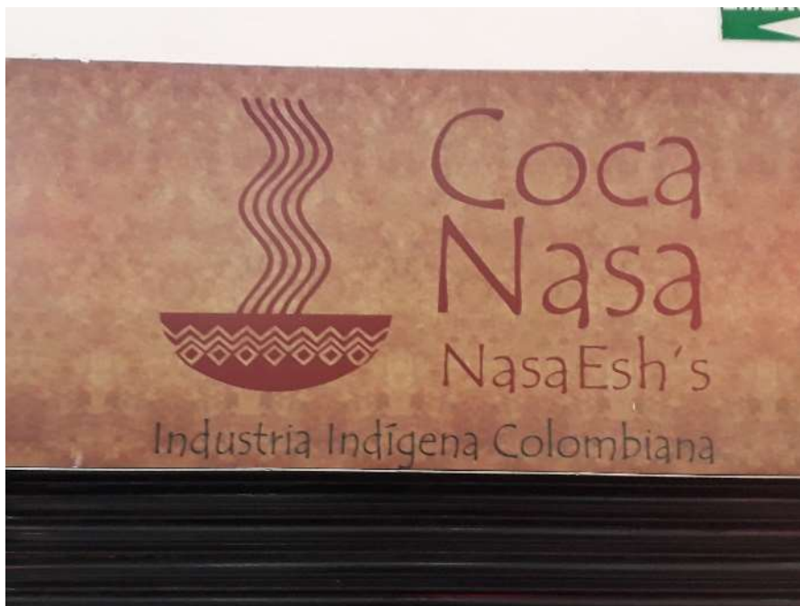
Figura 1. Foto da divulgação da Indústria Indígena Colombiana

É diante desse cenário, e a partir de leituras que compartilham dessa perspectiva crítica da relação entre turismo e alimentação, que experiências sociais concretas vêm sendo gestadas por sujeitos e movimentos sociais que disputam esses territórios, seus saberes e sabores, a exemplo dos produtores de Chocolate Premium, no assentamento Terra Vista, no sul da Bahia (MENEGAZZI, 2019) ou da indústria indígena colombiana, duas faces da afirmação da autodeterminação territorial vinculadas à alimentação e fortalecidas por um entendimento de que o turismo é uma mediação social em disputa, e não um apriori que deve impor uma racionalidade estranha às relações locais.