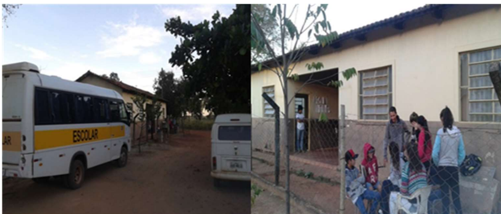
Foto 1. estado de Goiás – Faina - povoado de Araras - Espaço físico da Escola Municipal Bruno Freire de Andrade- 2019.

deu em homenagem aos primeiros moradores do povoado de Araras, especificamente ao patriarca da família Freire. A escola atende estudantes da Educação Infantil e da primeira e segunda fase do Ensino Fundamental no período matutino.