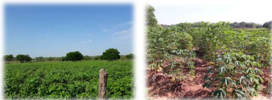
Figura 2. Plantio de feijão e de mandioca no PA Fazenda Flores.

A conquista da terra não encerra os problemas para as famílias assentadas, pois continuam necessitando de condições para a produção, serviços básicos como saúde e educação, e infraestruturas variadas. No entanto, apesar do seu caráter contraditório, os assentamentos possuem uma representatividade, pois se constituem como a principal política pública de acesso à terra no Brasil e conseqüentemente no estado do Piauí. As famílias do PA Fazenda Flores vivem uma vida simples, do trabalho na roça, desenvolvendo atividades produtivas tradicionais voltadas principalmente para o provisãoamento familiar, que também conta com a participação das mulheres no processo produtivo. Dentre estas atividades, destacam-se, o plantio de feijão, melancia, mandioca, milho, abóbora (Figura 2).