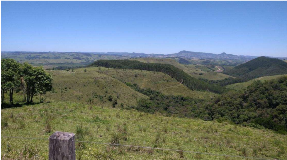
Figura 3. Vista panorâmica de parte do relevo da Comunidade Rural Saltinho

proprietário do equipamento, os demais entrevistados contratam horas de trabalho com trator nos períodos de plantio e colheita.