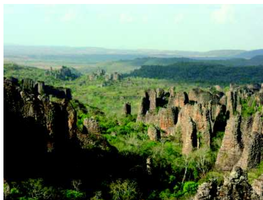
Fig.2 Cidade de Pedra, vue aérienne.

Cinq autres secteurs de concentration en abris rupestres sont discernables dans les paysages de Morros (fig.2) s'étageant de la bordure de la Chapada (par exemple les sites d'Anta con Quati (à l'est), Seta Barras (au centre), Acrobatas (à l'ouest) aux ultimes affleurements dominant la plaine alluviale, Cípo au nord, vers le centre. Chacun des petits affluents (plus ou moins torrentueux) dessine un paysage particulier. Les groupements de sites rupestres dans chacun de ces micro-bassins, à des altitudes variées mais plus denses à mi-hauteur du dénivelé Chapada-Rio sont bien apparentes et correspondent à des choix clairement faits par les Préhistoriques et