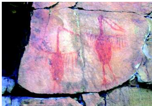
Fig.3 Abrigo do Tuiuiú. Couple de Jaburus.

Dans la région de la Cidade de Pedra, humains et animaux ne sont guère abondants (environ 250), contrairement à d'autres régions rupestres brésiliennes, par exemple le Nordeste, Bahia en particulier. Les animaux (un peu moins d'une centaine) rassemblent des mammifères (une cinquantaine), la plupart du temps non identifiables à l'exception d'onças (dans un site au cœur de la Cidade de Pedra), des oiseaux (une vingtaine dont des jaburus), presque autant de reptiles (serpents, lézards, tortues) et quelques poissons. Ce bestiaire n'est présent que dans un quart des sites, principalement dans les deux secteurs extrêmes (ouest et est). Les oiseaux se concentrent dans les 3 secteurs occidentaux, ce qui dénote une tendance thématique propre au bestiaire (fig.3).