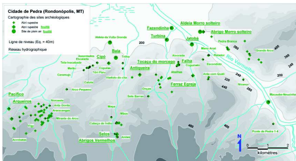
Fig.1 Carte (J.-R. Houllier et E. Vilhena de Toledo) de la région de la Cidade de Pedra avec localisation des principaux sites préhistoriques.

ment préhistorique, commencé autour de 10000 ans BP pour un site en plein air et de 6000 ans BP pour les sites en abri (selon les plus anciennes datations) s'est intensifié entre 2000 et 1000 ans BP selon les nombreuses datations d'occupations fouillées dans une dizaine d'abris rupestres et dans une demi-douzaine d'aldeias en plein air à proximité de la rivière (fig.1). Celle-ci forme un axe de circulation et d'implantation sur ses deux rives, encaissées au contact de la Cidade de Pedra, puis largement ouvertes en aval, en direction du Pantanal. Dans ce premier secteur pour l'analyse, en forme de passage étroit, les abris rupestres s'inscrivent à plusieurs niveaux des affleurements en falaise de la rive droite, et (à l'exception de deux d'entre eux) en hauteur des affleurements en rive gauche (Ponte de Pedra, par exemple).