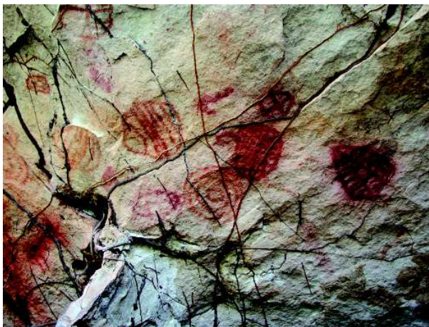
Fig.5 Abrigo Mano Aroe. Vue partielle du panneau de signes et motifs. CI. ADV

Un tiers des humains sont plutôt des anthropozoomorphes: c'est-à-dire des images d'une volontaire ambiguïté figurative, par exemple ce qui pourrait être un personnage à corps globuleux, membres courts et appendice céphalique inexpressif ou un batracien anoure, réduit à sa morphologie essentielle. On en trouve dans 4 des 6 secteurs, dont les extrêmes est-ouest, ce qui montre une large ubiquité de ce thème figuratif particulier.