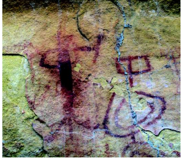
Fig.4 Abrigo dos Arqueiros. Arqueiro et motif.

ralement, on note l'opposition thématique entre la partie occidentale de la région de la Cidade de Pedra qui rassemble le plus grand nombre des représentations figuratives, animales et humaines, et la moitié orientale dominée par les signes. Les humains attestent de variations techno-stylistiques bien plus larges (fig.4) que celles dont font preuve les représentations animalières. Pour un quart, celles traitées en termes (plus ou moins) réalistes, sont incontestablement des figurations humaines (partielles ou non). Seulement deux portent un objet, en l'occurrence un arc bandé (abri Arqueiros, sur la bordure occidentale de l'aire).