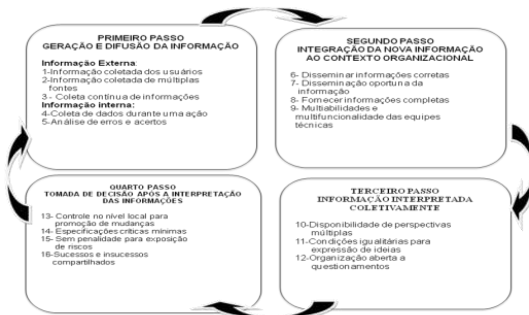
Figura 2 - Elementos do Ciclo da Aprendizagem Organizacional compatíveis com o PPGCI/UFPB

Do Modelo original proposto por Dixon, composto por 27 elementos (subcategorias), foram selecionados 22 para compor o sistema de categorias, que serviu de parâmetro para analisar as dimensões da informação que são adotadas na gestão da aprendizagem organizacional do ambiente analisado. Desses 22 elementos, dezesseis foram devidamente contemplados, como o demonstrado na Figura 2, representativa do fluxo observado pelo capital humano que o integra.