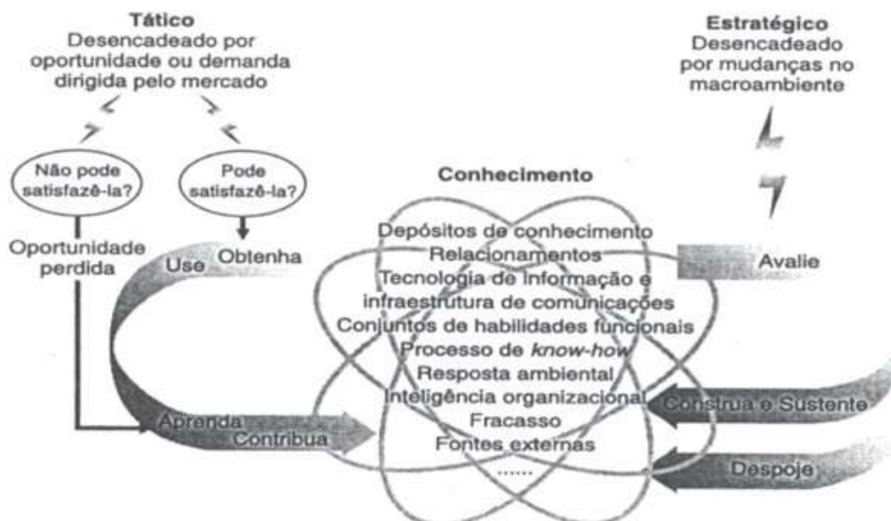
Figura 1 – Modelo de Bukowitz e Williams (2001)

Fonte: Bukowitz e Williams (2002, p. 24)