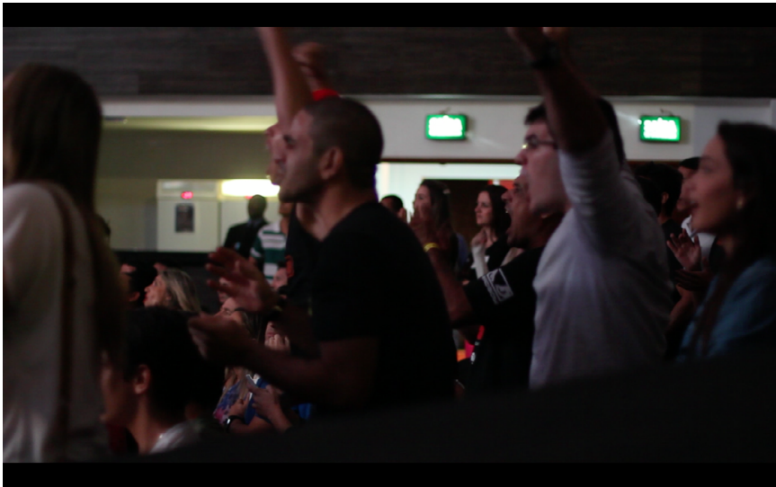
Figura 2 – Excitação em rosto