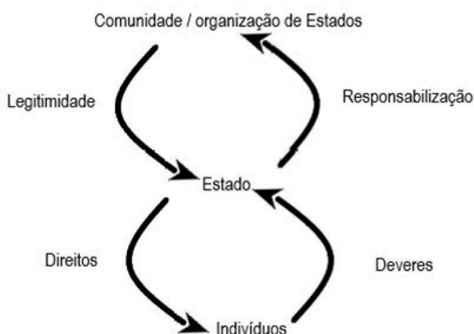
Figura 2 - Estrutura social dos direitos humanos

E existe também a estrutura social dos direitos humanos, de como se organiza a sociedade em torno deles.