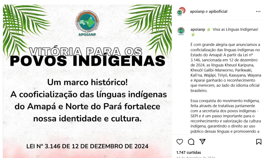
Fig. 6 – Divulgação da aprovação da Lei na página Instagram da APOIANP