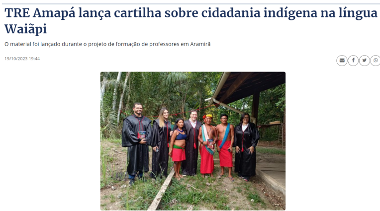
Figura 3: Lançamento de cartilha sobre cidadania em língua indígena.