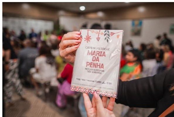
Figura 2: Cartilha Lei Maria da Penha em 4 línguas indígenas