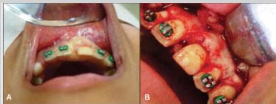
Figuras 3A e 3B: Biópsia excisional (transcirúrgico).