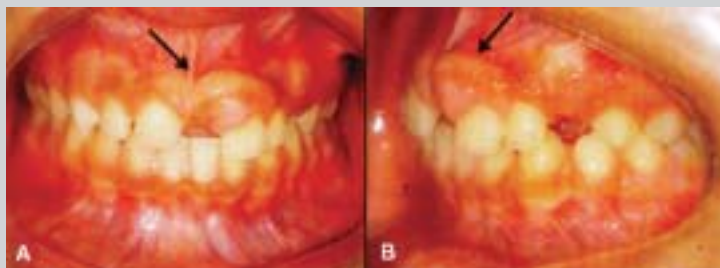
Figuras 1A e 1B: Exame clínico intraoral. (Aumento de volume nodular, séssil e lobulado em gengiva maxilar anterior - setas).

clínicos e histopatológicos, foi confirmado o diagnóstico de osteoma. A paciente continua em tratamento ortodôntico e encontra-se sob proervação há 01 ano, sem sinais de recidiva.