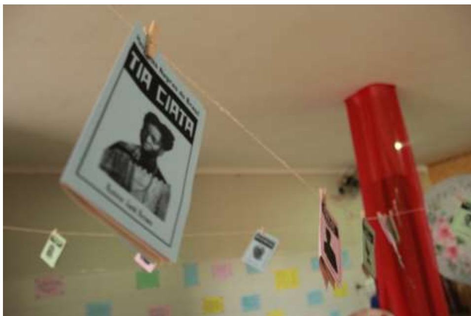
Figura 7 – Momento da mística, 2020.

e quando apreendiam nas batalhas as armas dos Bandeirantes, transformavam os armamentos, principalmente, em panelas para alimentar o povo quilombola. Aqualtune, princesa guerreira do Congo, escravizada no Brasil, símbolo de resistência, liderou e expandiu o Quilombo dos Palmares e foi avó de Zumbi dos Palmares. Zeferina, rainha, guerreira, que fundou o quilombo do Urubu, era também estrategista de guerra. Tia Ciata exercia sua liderança religiosa por ser Mãe de Santo, sua casa era um ponto de cultura e resistência negra, abrigando os/as sambistas e capoeiristas marginalizados/as e perseguidos/as pela polícia. Tia Simoa liderou o processo de luta e resistência negra pelo fim da escravização de pessoas no Ceará.