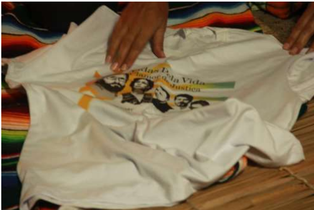
Figura 5 – Momento da mística, 2020.