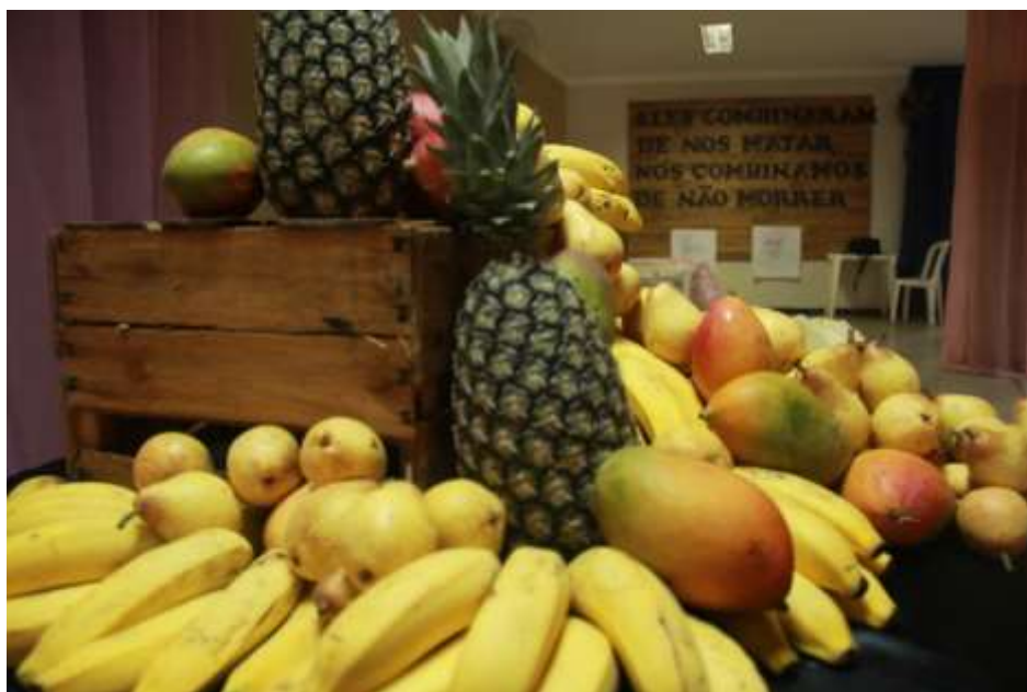
Figura 8 – Momento da mística, 2020.