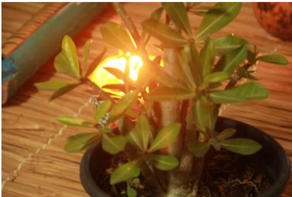
Figura 2 – Momento da mística, 2020.

A autora bell hooks (1993) também fala sobre a ação transformadora e revolucionária do amor no processo de re-existência contra o machismo, o racismo, o sexismo e a pobreza, podendo inclusive alterar as estruturas sociais existentes, porque [...] quando conhecemos o amor, quando amamos, é possível enxergar o passado com outros olhos; é possível transformar o presente e sonhar [com] o futuro. Esse é o poder do amor. O amor cura (HOOKS, 1993, p. 12). O amor liberta, humaniza e permite compor histórias de re-existência com o outro.