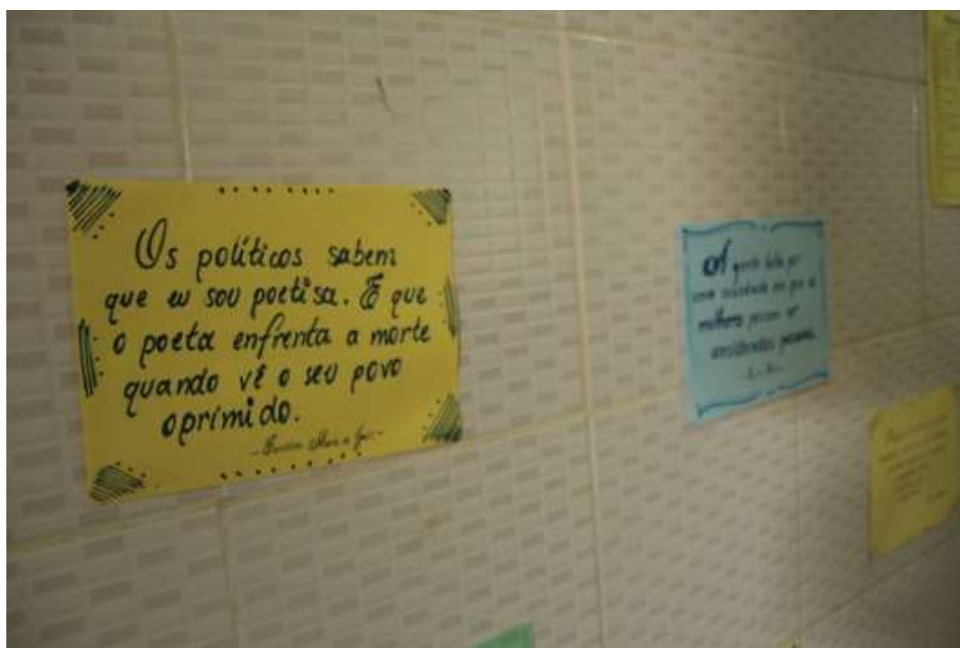
Figura 3 – Momento da mística, 2020.

No encontro com essas mulheres, aproximamo-nos da literatura da escritora Carolina Maria de Jesus (2014), mulher negra, autodidata, feminista, dramaturga, romancista, compositora, cantora, atriz, poetiza, favelada, catadora de papelão e mãe solo. Com ela, aprendemos que a escrita alimenta a nossa existência enquanto força revolucionária, sendo um espaço de denúncia ao descaso do governo diante das precárias moradias, do desemprego, do alcoolismo, da violência doméstica, da falta de saneamento básico e da fome. Diante de tanta mazela, a autora questionava a democracia, as desigualdades sociais e raciais e o posicionamento dos governantes da época. Carolina Maria de Jesus narrou: os políticos sabem que eu sou poetisa. E que o poeta enfrenta a morte quando vê o seu povo oprimido (JESUS, 2014, p. 39), destacando a poesia como prática de re-existência individual e coletiva.