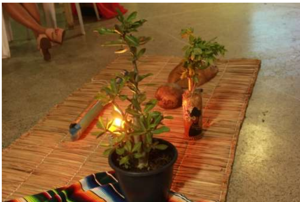
Figura 1 – Momento da mística, 2020.

Em Insubmissas Lágrimas de Mulheres (2016), a escrevivência é uma forma que as mulheres negras encontraram para registrar as suas memórias individuais e coletivas, a partir das experiências dos corpos femininos negros marginalizados, que não se permitem ser capturados e aprisionados, que recorrem também à escrita como possibilidade de se curarem das injustiças e opressões cotidianas, a fim de experimentarem habitar outros mundos (EVARISTO, 2016), evidenciando o que existe de mais humano em nós.