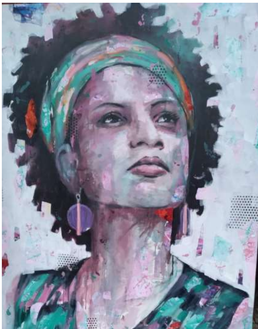
Figura 6 – Quadro de Marielle Franco no Rio de Janeiro, 2022.