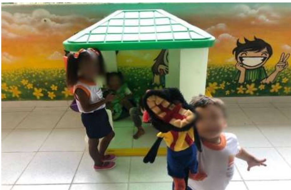
Figura 6. Interações na UMEI Regina Leite Garcia.