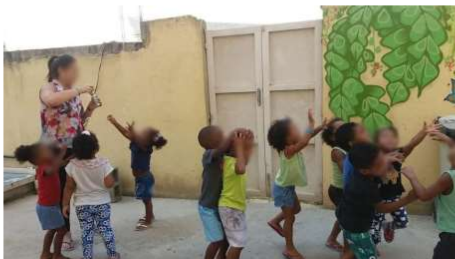
Figura 7. Interações na UMEI Regina Leite Garcia.