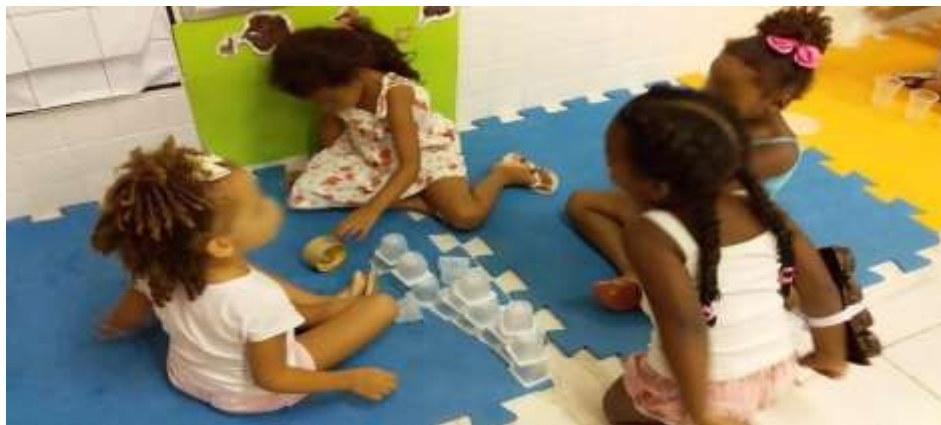
Figura 5. Interações na UMEI Regina Leite Garcia.