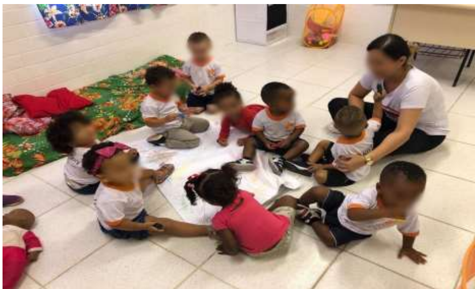
Figura 8. Interações na UMEI Regina Leite Garcia.