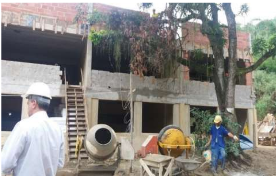
Figura 2. Construção da UMEI, ano de 2015.