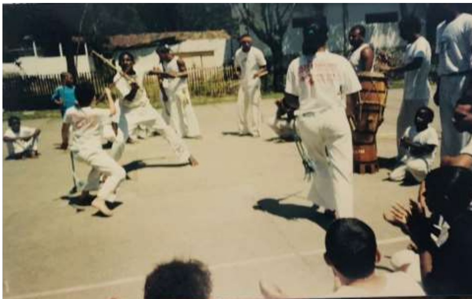
Registro do espaço recém pavimentado na época. Atualmente abriga a Clínica da Família e UMEI.