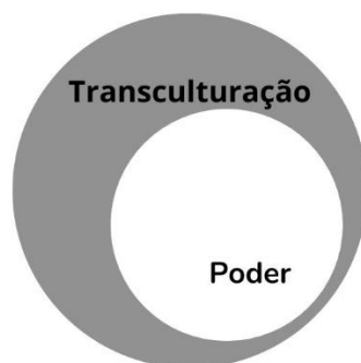
Figura 3 – Transculturação e poder