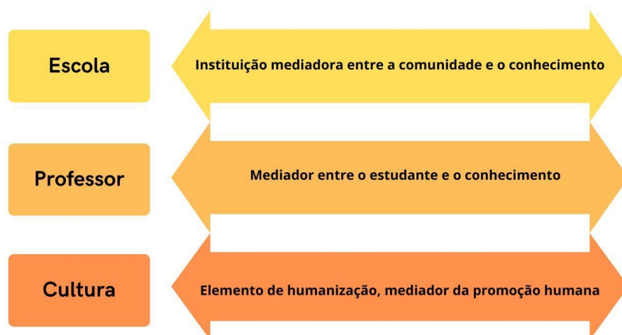
Figura 1 – Prerrogativas do currículo