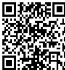
Figura 5 - QR Code para acesso à canção Balada de Gisberta na interpretação ao vivo de Maria Bethânia

Ainda assim, o “currículo encarnado” reexiste na fotografia viva, na assinatura sem linhagem patriarcal, na Balada da Gisberta (Figura 5) como homenagem, lembrança e luto(a), nos movimentos “Cartas para Gisberta” 28 , inspirando tantas mulheres a não se calarem diante das injustiças e “Se A Rua Fosse Minha” 29 , a qual disputa memórias trans* no mapa urbano do Porto. São “pedagogias insurgentes”, que tensionam estruturas de saberpoder por dentro, abrindo fissuras nas racionalidades hegemônicas e criando “táticas” de sobrevivência nos modos criativos de ocupação sub-reptícia do espaço instituído. O “currículo encarnado” opera assim — sem garantias definitivas, mas persistente —, como flores que brotam nas rachaduras do concreto. A poética das ruas atravessa o cenário de luto estático, convertendo-se em laboratório vivo, onde a teoria se põe à prova e encarna resistências pedagógicas contra a imposição de “não-lugares” cis-hegemônicos.