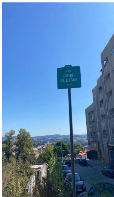
Figura 4 – Registo da Rua Gisberta Salce Júnior no Porto

Ao chegar, a rua materializou-se em precariedade inefável, curta, isolada, sem comércio aparente, com escasso movimento. A placa oficial — verde com letras brancas — confirmava a localização. Ao fazer o registro fotográfico (Figura 4), nesse instante, outra questão ganhou peso no corpo: Por que aqui? Que tipo de reconhecimento é esse, que preserva a marginalização espacial, historicamente imposta à população trans* 21 ?