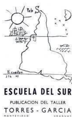
Figura 2 – América Invertida

O artista Torres Garcia questionou por meio de seu trabalho artístico a ideia de uma América Latina dominada ao propor sua América Invertida (Figura 2), trabalho produzido em 1943.