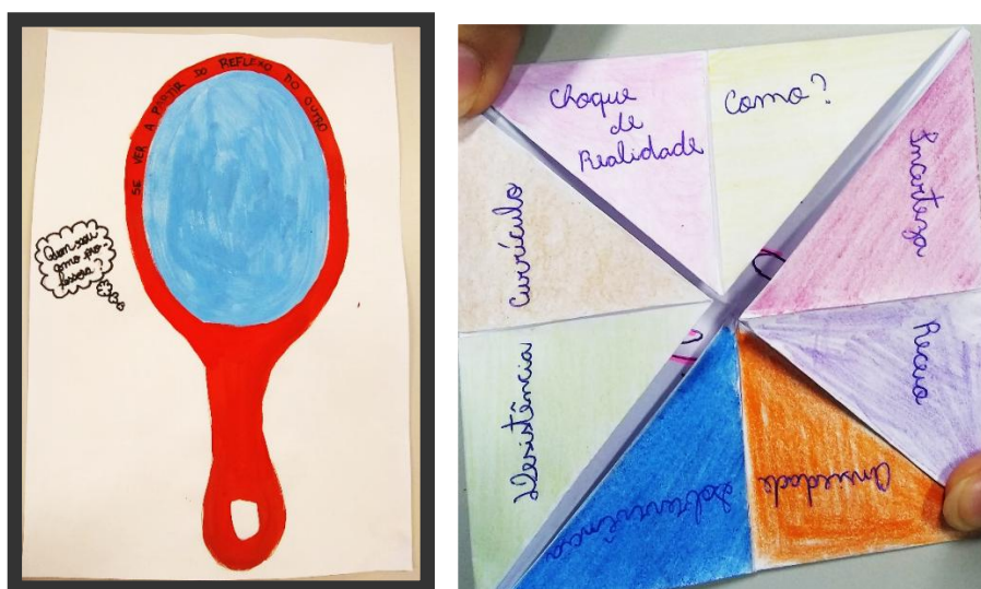
Figura 2 – Representações do ser professor(a) iniciante em um contexto de incertezas

Apresento dois exemplos, na Figura 2 – Representações do ser professor(a) iniciante em um contexto de incertezas , que traz conhecimentos outros possíveis na tessitura curricular em que o autor vai construindo seus saberes e modos de interpretação da pesquisaformação em movimento com imagens, compondo, artisticamente, o seu estudo, conforme produções feitas junto com algumas participantes da sua pesquisa, mostradas a seguir: