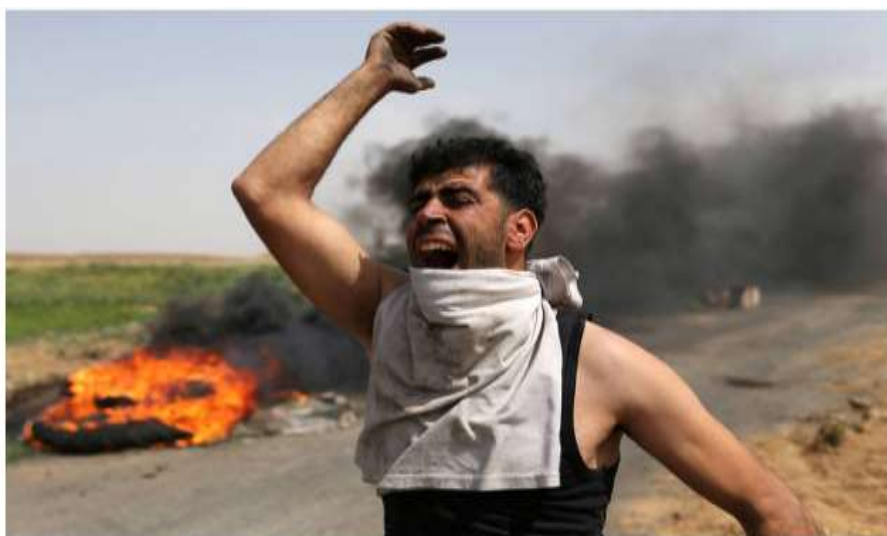
Manifestante palestino grita durante protesto contra Israel em acampamento de refugiados no sul da faixa de Gaza

Além disso, a reportagem também adota uma linguagem tendenciosa, inculcando um juízo de valor à única figura palestina que ganha autoridade de fala na reportagem. O lado palestino é apresentado junto ao temor israelense de que o Hamas se aproveite das “manifestações públicas para enviar terroristas para solo israelense” (grifo nosso). Por sua vez, as imagens que ilustram esta mensagem são expostas em um carrossel de fotos de eventos ocorridos em 2017 e uma foto sem data que abre a notícia (ver abaixo), acompanhada de legenda onde traduz a imagem como um “manifestante palestino grita durante protesto contra Israel em acampamento de refugiados no sul da Faixa de Gaza”.