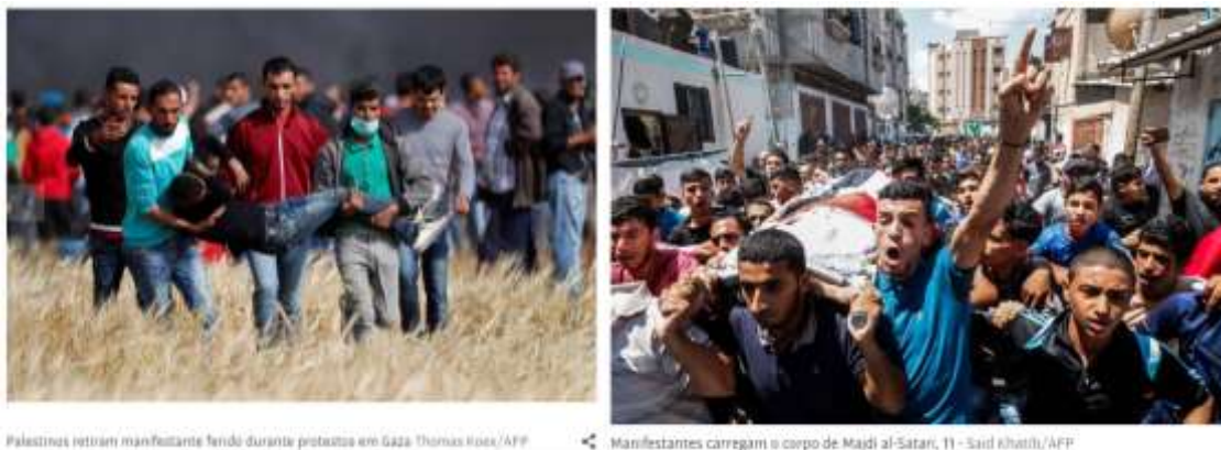
Foto 1 - Morto ou Ferido Palestino (KOEX, Thomas) / Foto 2 - Luto Palestino (Khaib, Said) 13

pessoas aparecem em maior número e, assim como nas fotos representando luto, só observamos palestinos nestas situações.