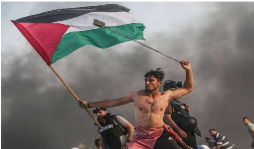
Homem empunha bandeira palestina enquanto arremessa pedra com uma funda, em cidade ao norte de Gaza

bandeira palestina em sua mão direita e balançando um estilingue com a esquerda”, já na reportagem da Folha de São Paulo, a leitura no título auxiliar diz sobre “foto de um palestino arremessando pedras contra soldados israelenses em Gaza” e na legenda da foto a imagem é lida como “homem empunha bandeira palestina enquanto arremessa pedra com uma funda, em cidade ao norte de Gaza”.