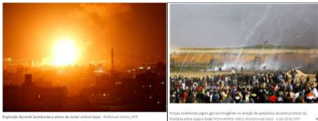
Foto 5 - Israel Aplicando Violência /Foto 6 – Forças Israelenses 15

No que diz respeito a sofrer violência, também só são encontradas imagens de uma pessoa/grupo palestino. Ao retratar aglomerações que não estão sofrendo nem aplicando violência, as legendas costumam usar o termo “protesto” ao se referir aos Palestinos enquanto a única aglomeração de israelenses é descrita como uma “comemoração”. O número de fotos representando destruição de símbolos ou arquitetura não tem grande variação entre os dois atores, já nas imagens que representam figuras governamentais, observamos apenas figuras políticas de Israel (Dori Goren) ou Estados Unidos (Donald Trump). Por fim, há algumas imagens que ilustram as reportagens selecionadas, mas não se encaixam em nenhuma das categorias acima e não dizem respeito à Israel e Palestina diretamente e foram sinalizadas como “outras”.