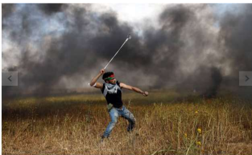
Palestino se prepara para jogar pedra em direção dos soldados israelenses na faixa de Gaza

A cobertura do primeiro dia da Grande Marcha do Retorno relata que apesar da promessa de ser uma marcha não violenta, houve um movimento de “violência” dos “manifestantes palestinos” e acusa que estes usaram coquetéis molotov, pneus incendiados, pedras e bombas. A atuação de Israel é relatada como uma resposta a essas “violências” e suaviza o uso de munição letal e atiradores de elite contando que estes foram usados “contra os que chegaram mais perto”. Nesta ocasião, apenas uma das fotos utilizadas retrata o dia da Marcha em si e a legenda traduz a imagem como um palestino aplicando violência com pedras (ver abaixo).