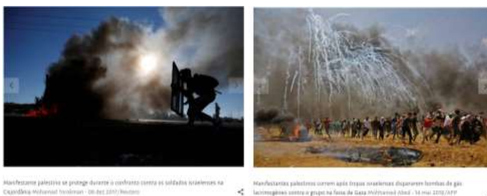
Foto 7 – Palestino Sofrendo Violência (MOHAMMED, Torokman) / Foto 8 – Forças Israelenses (MOHAMMED, Abed) 16

No que diz respeito a sofrer violência, também só são encontradas imagens de uma pessoa/grupo palestino. Ao retratar aglomerações que não estão sofrendo nem aplicando violência, as legendas costumam usar o termo “protesto” ao se referir aos Palestinos enquanto a única aglomeração de israelenses é descrita como uma “comemoração”. O número de fotos representando destruição de símbolos ou arquitetura não tem grande variação entre os dois atores, já nas imagens que representam figuras governamentais, observamos apenas figuras políticas de Israel (Dori Goren) ou Estados Unidos (Donald Trump). Por fim, há algumas imagens que ilustram as reportagens selecionadas, mas não se encaixam em nenhuma das categorias acima e não dizem respeito à Israel e Palestina diretamente e foram sinalizadas como “outras”.