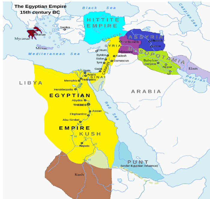
Figura 2. Mapa do Antigo Egito