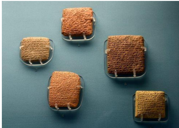
Figura 1. As Cartas de Amarna