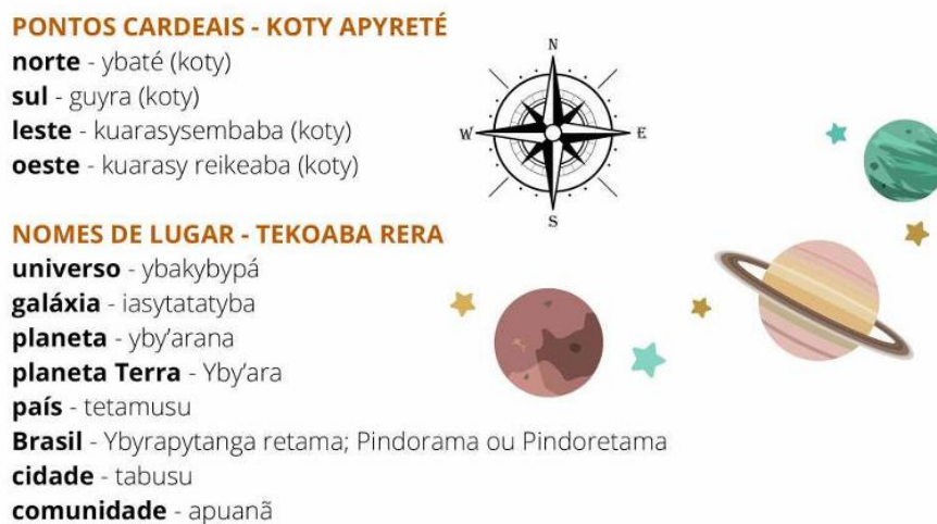
Figura 1 – Vocabulário neológico na obra Tupi Potiguara Kuapa

organizado por professores Potiguara para uso na educação escolar indígena. Como fontes para as análises de tradução dos itens lexicais, utilizamos a consulta lexicográfica, baseada sobretudo no Dicionário de Tupi Antigo, de Navarro (2013) e no material pedagógico de autoria indígena Tupi Potiguara Kuapa. Este último conta com um apêndice de vocabulário no final, trazendo novas extensões semânticas aplicadas ao contexto Potiguara, ou seja, itens lexicais que tiveram seu sentido ampliado com o uso em contexto de revitalização, como mostra a figura 1. Entendemos que a consulta a materiais didáticos indígenas de produção recente traz como vantagem, além do protagonismo indígena, o enfoque na língua como vem sendo utilizada no atual contexto de retomada, inclusive com usos que o dicionário da língua “antiga” não comportaria. Algumas traduções de Toré apareceram no primeiro material didático de língua tupi específico para o povo Potiguara, elaborado pelo professor Josafá Freire, em 2005. Nesta pesquisa, porém, optamos por nos guiar pela publicação mais recente.