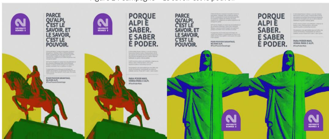
Figure 2 : Campagne « Le savoir est le pouvoir »