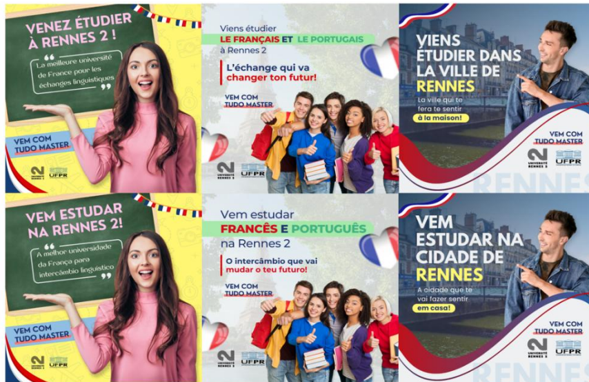
Figure 1 : Campagne « Venez étudier à Rennes 2 ! »

Source : réalisé par les étudiantes et étudiants ayant participé au projet.