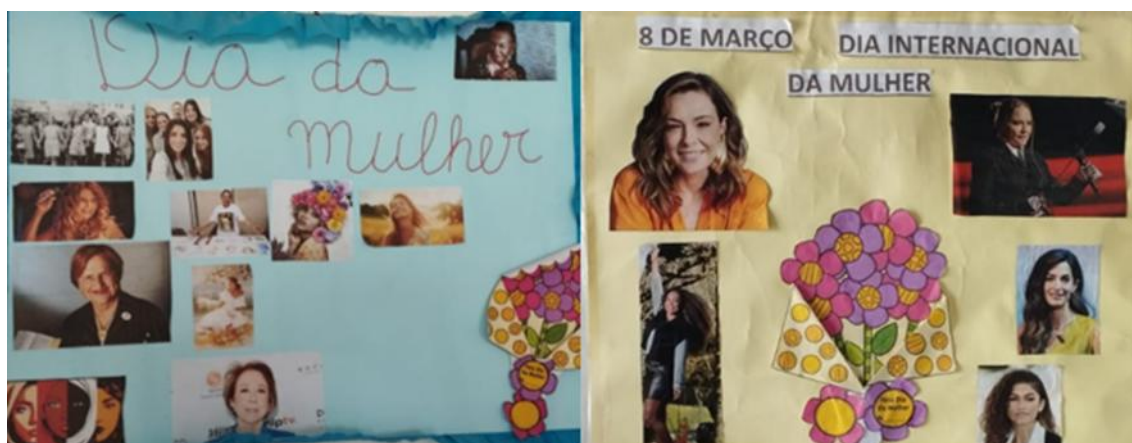
Figura 01 – Atividade em alusão ao Dia Internacional da Mulher