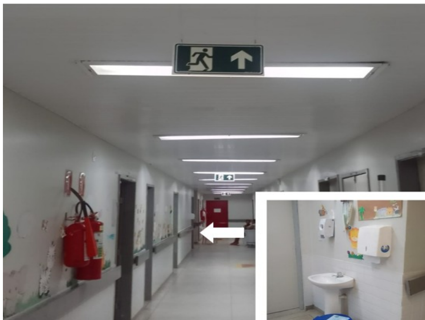
Figura 2- Lavabo para higienização das mãos pelos profissionais de saúde no corredor principal e sinalização da rota de fuga da ala de internação de Pediatria do Hospital Universitário Lauro Wanderley, João Pessoa, PB, 2024

Com base nos dados apresentados no Quadro 1 e Figura 3 , foi elaborada a análise preliminar de riscos (APR), que está demonstrada no Quadro 3 . Neste, observa-se que a exposição a riscos biológicos teve, pela combinação de frequência e severidade, o resultado de risco elevado, pois a probabilidade de ocorrência foi considerada alta, e as consequências podem ser graves.