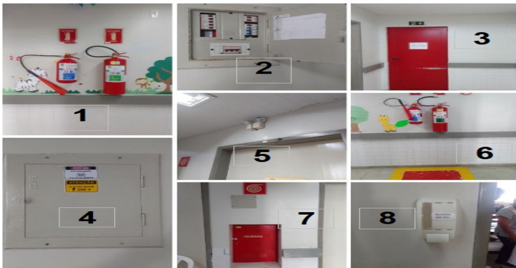
Figura 1 – Foto documentação dos espaços comuns do setor de internação de Pediatria do Hospital Universitário Lauro Wanderley, João Pessoa-PB, 2024

Realizou-se uma inspeção de segurança no setor de interesse para observar sua estrutura física interna do setor de hospitalização pediátrica, identificando potenciais riscos e as medidas implantadas para a redução dos riscos ambientais e de acidentes ocupacionais. As imagens obtidas fotograficamente no setor estão demonstradas nas Figura 1. Nesta, as fotos foram numeradas sequencialmente de 1 a 8, com a seguinte identificação: 1. Extintores de incêndio (CO 2 e água) e sinalização de identificação; 2. Quadro de luz sem identificação dos disjuntores (parte interna); 3. Saída de emergência sinalizada; 4. Quadro de luz com sinalização de segurança (parte externa); 5. Luz de emergência; 6. Extintores de segurança com sinalização no piso e vertical; 7. Abrigo de hidrante; e 8. Dispensadores de álcool em gel.