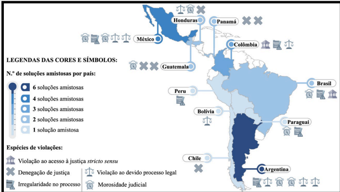
Figura 01: Mapa das violações de acesso à justiça resolvidas amistosamente na CIDH, com número e espécies de violação por Estado

Nota: Mais de uma espécie de violação pode ser mencionada em cada petição.