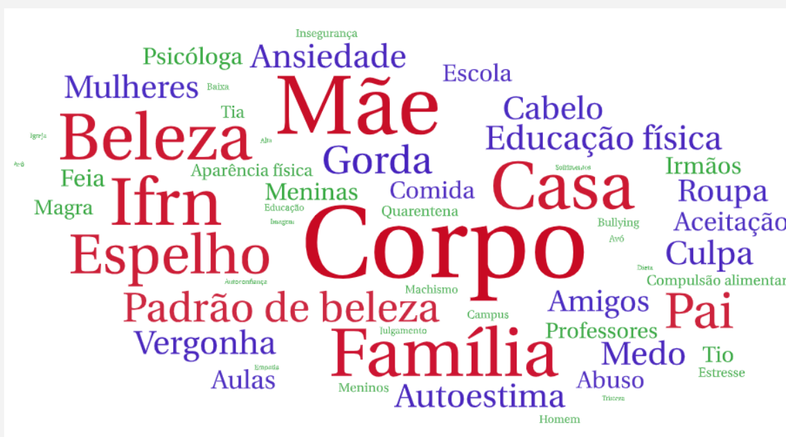
FIGURA 1 – Nuvem de palavra dos diários solicitados

bibliográficas que constituíram o referencial teórico do nosso estudo e sinalizaram para as questões de sofrimento vinculadas à imagem corporal, assim como para as influências sociais no processo de construção da imagem corporal, considerando a ideia de que o processo de socialização na adolescência se dá, especialmente, por meio dos vínculos estabelecidos na família e na escola.