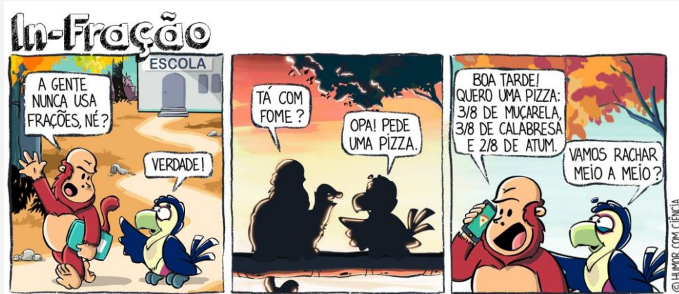
Figura 5 - Tirinha do Segundo Encontro – Tuca: In-fração