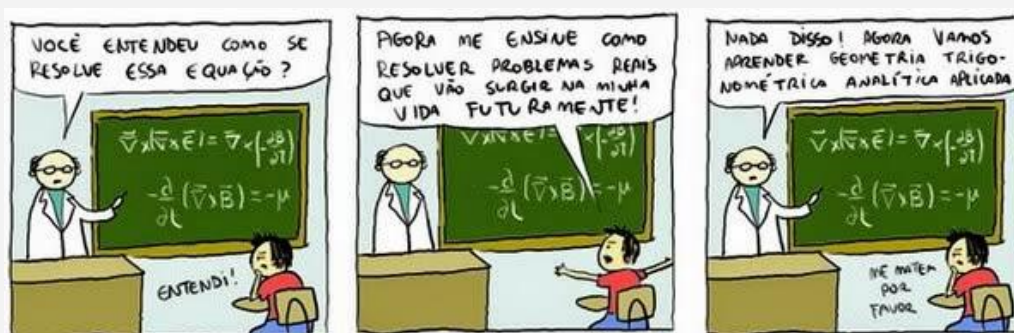
Figura 7 – Tirinha do Terceiro Encontro – O professor

A inquietação dos professores diante da segunda tirinha do terceiro encontro esteve centrada na complexidade da matemática.