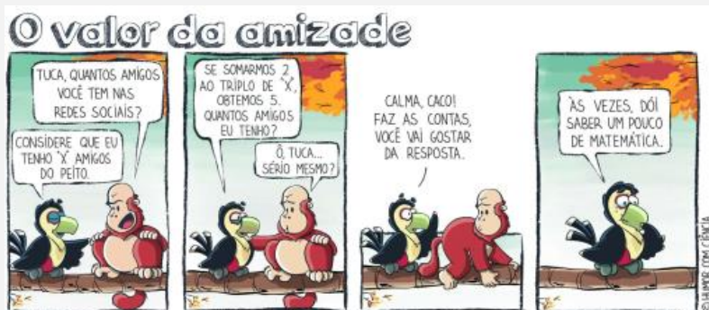
Figura 6 – Tirinha do Terceiro Encontro – Tuca: o valor da amizade

Fonte: https://www.humorcomciencia.com/blog/124-matematica/