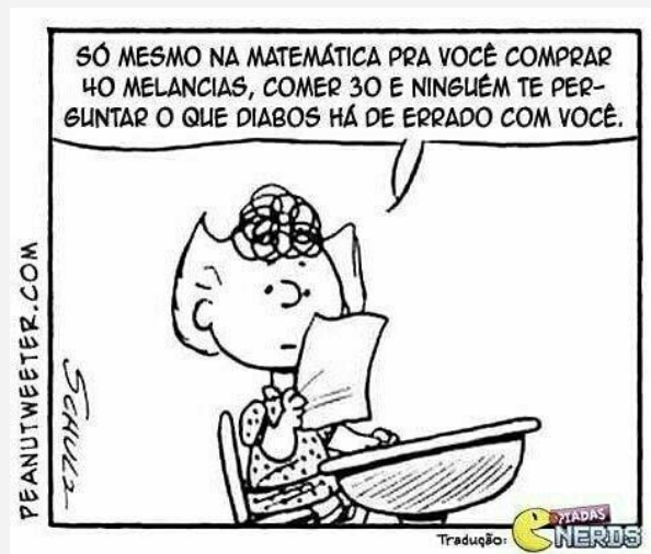
Figura 4 – Tirinha do Segundo Encontro – Turma do Snoop