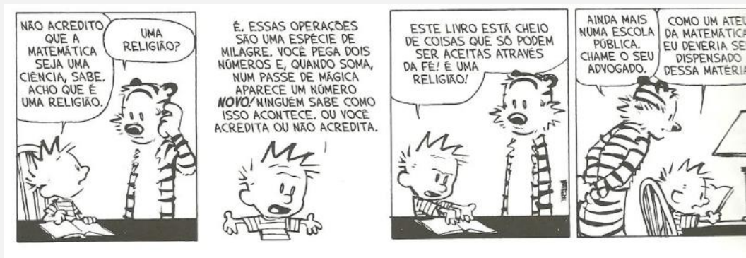
Figura 2 – Tirinha do Primeiro Encontro – Calvin