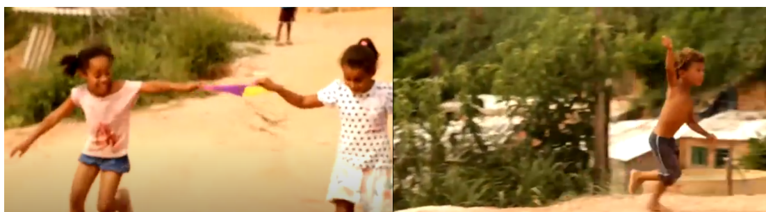
Figura 5– O deleite do momento.