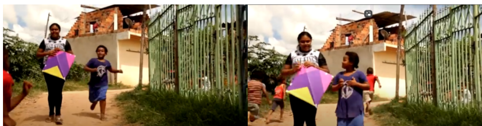
Figura 2 – As corridas como lampejos.

Fonte: elaborado pelas autoras através de capturas do filme, 2025.