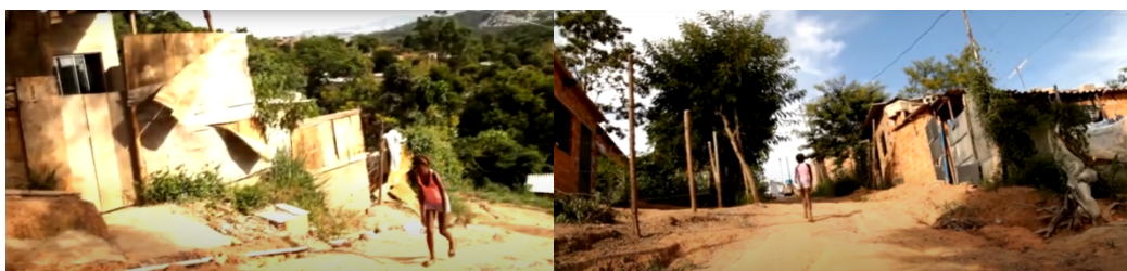
Figura 8 – Cena final.