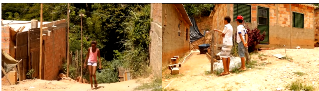
Figura 3 – O estilo das moradias da ocupação.