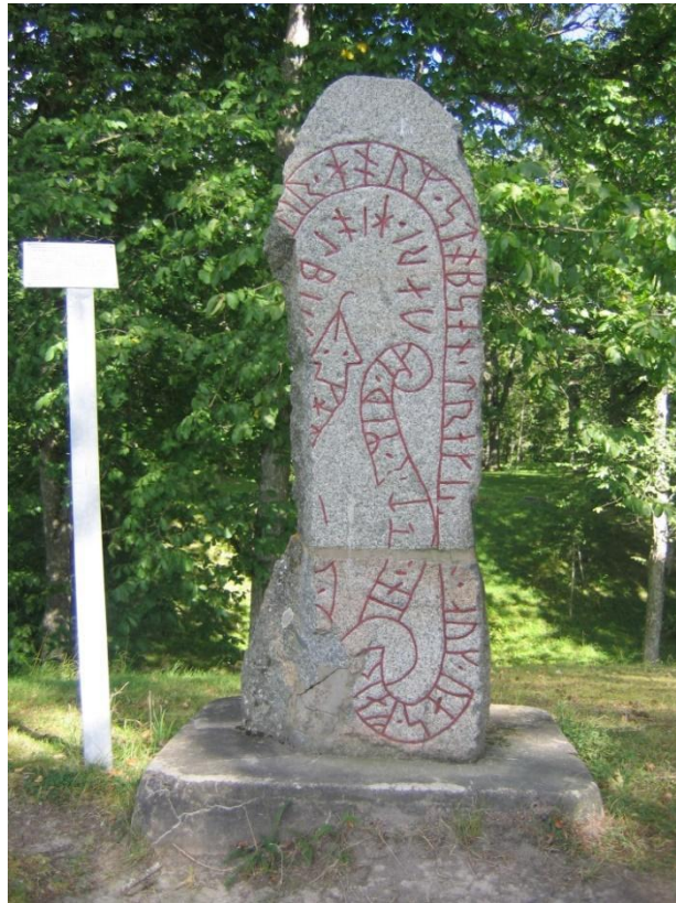
Figura 3: Vs. 19. Estela contendo inscrições rúnicas cravadas por Gunnvaldr, datada entre 1040 e 1049.

a complexa relação de transição das crenças nórdicas tradicionais ao cristianismo, contendo elementos notáveis das tradições pagã e cristã.