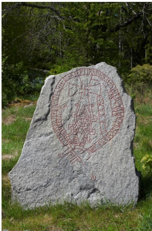
Figura 5: U 1016 , estela contendo inscrições rúnicas cravadas por Ljótr, datada entre 1000 e 1033. Imagem disponível em: https://app.raa.se/open/runor/inscription?id=78bfb3ef-83ee-4428-be9f-6c30b45cc6d7 . Último acesso em 03/01/2025.

Apesar da notabilidade das transações comerciais entre mercadores escandinavos e bizantinos, o que foi refletido na cultura material, especialmente na U 1016 , um vasto quantitativo das estelas rúnicas suecas que se referem ao Império Bizantino trazem fortes alusões às relações militares, seja a saques e campanhas militares nórdicas direcionadas a Bizâncio, seja com menções a comandantes, capitães ou guerreiros de camadas subalternas escandinavos que serviam na própria organização de defesa bizantina, o que nos permite um aprofundamento ainda mais vigoroso no estudo da guarda varegue, tanto no que se refere ao seu impacto na defesa imperial, quanto a sua constituição a partir da integração das forças escandinavas. O quantitativo de estelas suecas com conotação militar é parte fundamental da constelação documental que pode atuar como fontes indispensáveis para a compreensão da guarda varegue, tal como as já mencionadas inscrições nórdicas na catedral de Hagia Sophia e também a documentação textual, especialmente a Sinopse da História Bizantina: 811 – 1057 e a Haralds saga Sigurðarsonar .