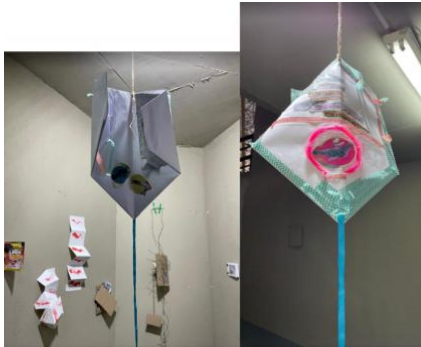
Figura 5: Imagem do Livro pipa, criado por família durante a primeira oficina