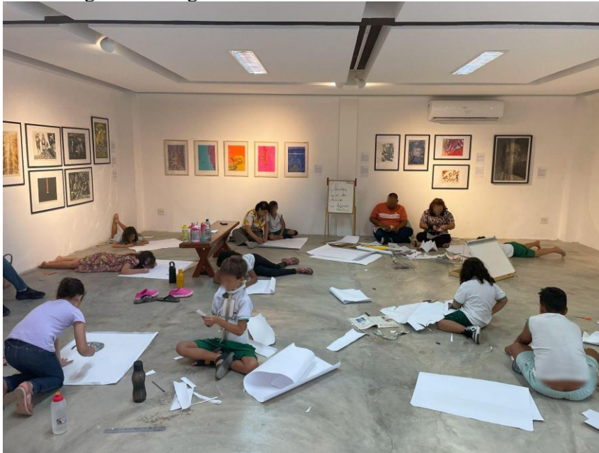
Figura 4: Imagem da oficina realizada na Galeria Lavandeira