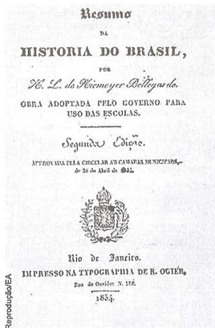
Fig. 1 – Capa da edição de 1834 da obra de Henrique Luiz de Niemeyer Bellegarde, Resumo da História do Brasil .

utilizado, inclusive, nos dois níveis de escolarização, ou seja, no de primeiras letras e no secundário. Todavia, essas informações não nos dão a garantia que os seus conteúdos tenham sido adotados como “pontos” para os exames públicos e de que tenha sido utilizado como livro de leitura no cotidiano escolar das primeiras letras, apesar das indicações prescritivas orientarem os professores para a sua utilização.