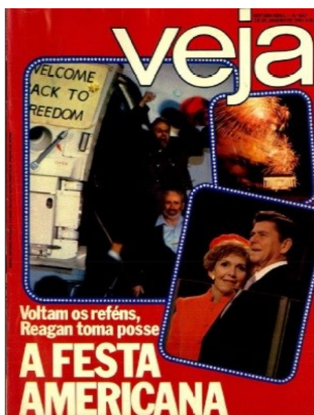
Figura 4 - Capa da revista Veja com o título: A festa americana

A Edição nº 647, do dia 28 de janeiro de 1981, trazia em sua capa o retorno dos reféns americanos após os 444 dias que ficaram detidos sob o controle dos estudantes iranianos na embaixada estadunidense em Teerã. Terminava, assim, a “crise dos reféns” iniciada em novembro de 1979. Na capa, além da imagem de alguns reféns descendo do avião e acenando com a expressão de felicidade, estava logo abaixo Ronald Reagan e sua esposa com imagem de fogos de artifício para uma dupla comemoração: a resolução positiva da crise diplomática e a vitória nas urnas de Reagan. O título da capa era sugestivo: “A festa americana”.