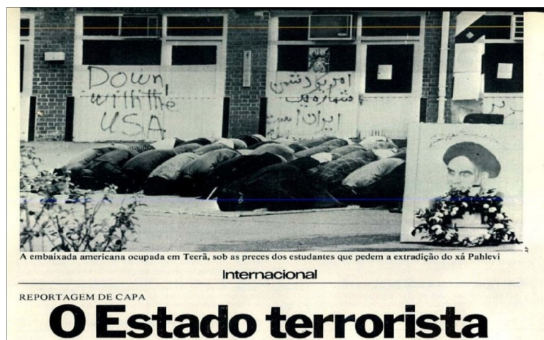
Figura 2 - iranianos orando em frente à embaixada dos EUA em Teerã