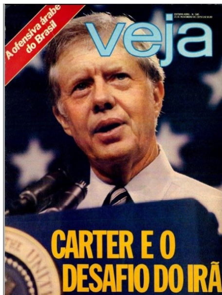
Figura 3 - Capa da revista Veja com o título “Carter e o desafio do Irã”

A Edição nº 585, lançada em 21 de novembro de 1979, trazia em sua capa o presidente Jimmy Carter com um olhar angustiado e, ao mesmo tempo, de incerteza, tendo em vista que estava diante de um embate diplomático longe de uma resolução. Teria ele que encontrar uma saída urgente para a situação dos reféns; contudo, teria igualmente, o chefe de estado estadunidense, de manter o pragmatismo histórico norte-americano, ou seja, não poderia negociar com terroristas. Veja inicialmente ressaltaria o poderio militar dos Estados Unidos, país que teria, segundo o periódico, a capacidade de resolver a situação com “um aperto de botão”. No entanto, fraquejava devido à moderação do presidente, Jimmy Carter, o qual pretendia encontrar uma solução não belicosa para o caso.