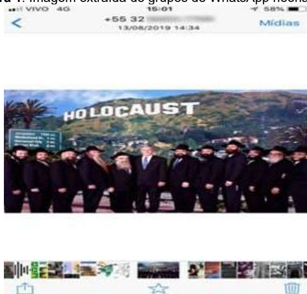
Figura 1: Imagem extraída de grupos de WhatsApp neonazistas.