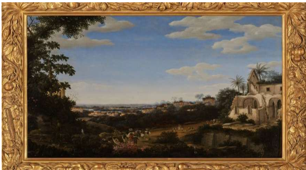
Figura 1 – Quadro 'Vista de Olinda, Brasil, com ruínas da Igreja dos Jesuítas', pintado pelo holandês Frans Post em 1666 1 .