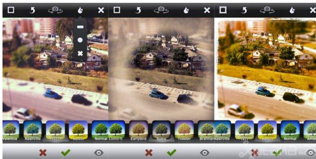
A mesma imagem com resultados diferentes (efeitos do aplicativo)

em relação à vivacidade cromática; já o uso de molduras define o tipo do quadro a envolver a imagem, em que juntamente com os filtros criam concepções diferenciadas, que vão de cores quentes, com tons entre o vermelho, amarelo e laranja; a cores frias, tons azulados e acinzentados.