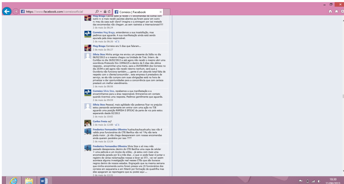
Figura 3 - Conta dos Correios no facebook.

Entretanto, as regras não inibem questionamentos dos clientes, que utilizam o canal para fazer queixas. Como no caso da figura abaixo, em que campo destinado à divulgação de um evento foi utilizado por usuários para postagem de reclamações.