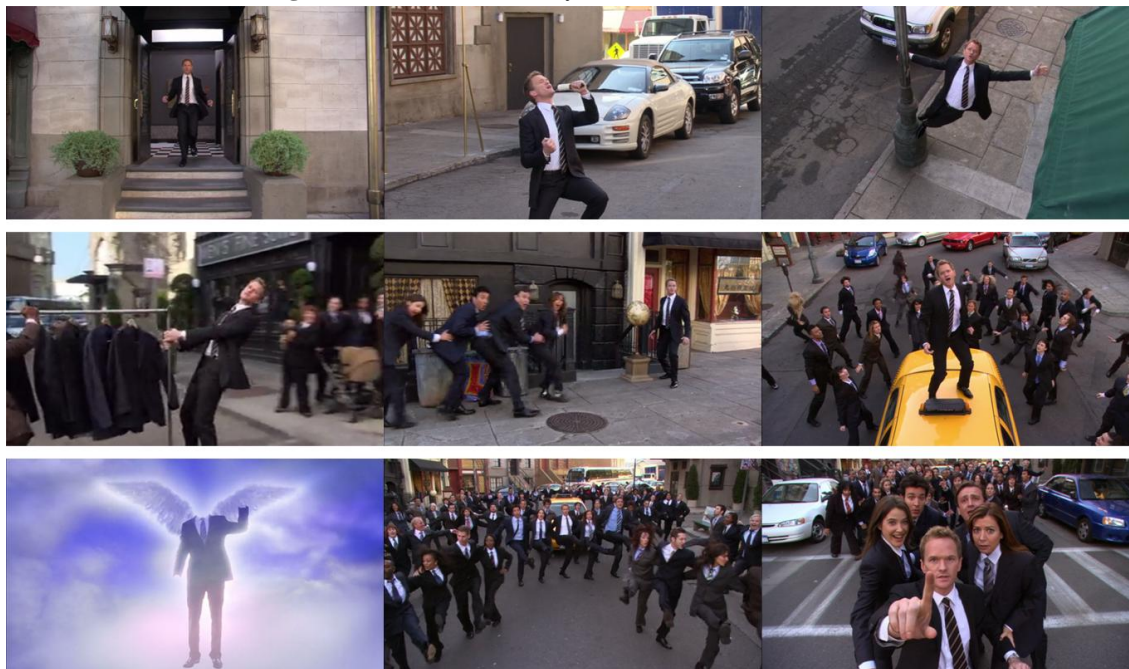
Figura 7: Musical de Barney em How I Met Your Mother