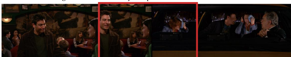
Figura 4: Efeito de transição no piloto de How I Met Your Mother