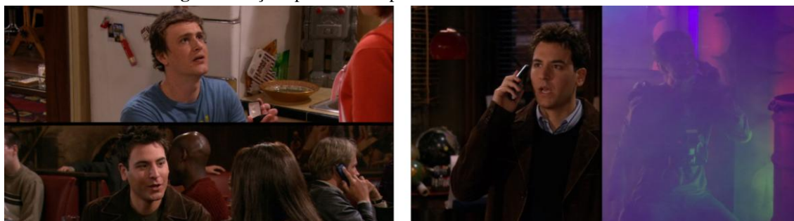
Figura 3: Ações paralelas no piloto de How I Met Your Mother