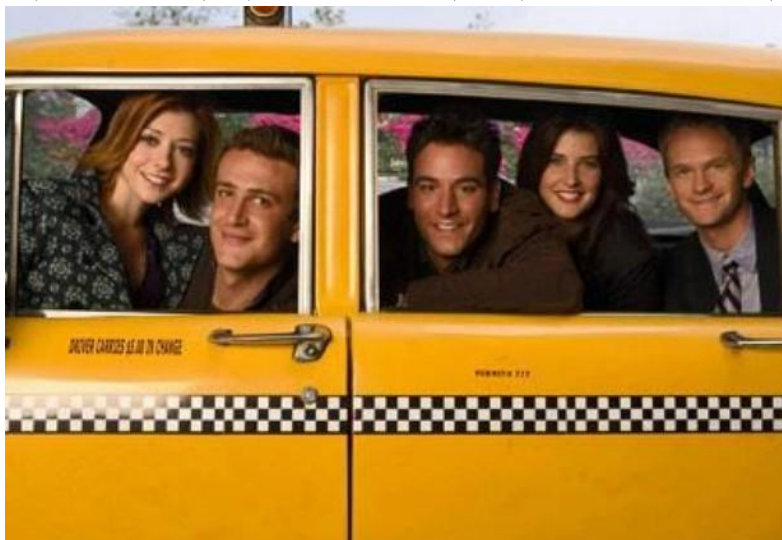
Figura 1: Atores da série How I Met Your Mother . Na ordem: Alyson Hannigan (Lily), Jason Segel (Marshal), Josh Radnor (Ted), Cobie Smulders (Robin) e Neil Patrick Harris (Barney)