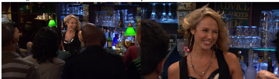
Figura 5: Técnicas formais no momento em que a turma conhece a nova funcionária do bar