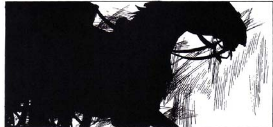
Figura 17: Quadro Vol. 1 (op. cit. p. 85)

Com relação ao olhar do leitor enquanto observa uma imagem, conforme Eisner (1999), sabe-se que, na cultura ocidental, a leitura é realizada da esquerda para a direita e de cima para baixo. A disposição dos quadrinhos numa página também parte desta hipótese. “Na prática, porém, essa norma não é absoluta. Frequentemente, o espectador dá primeiro uma olhada no último quadrinho. Contudo, o leitor obrigatoriamente acabará voltando ao padrão convencional” (EISNER, 1999, p. 41).