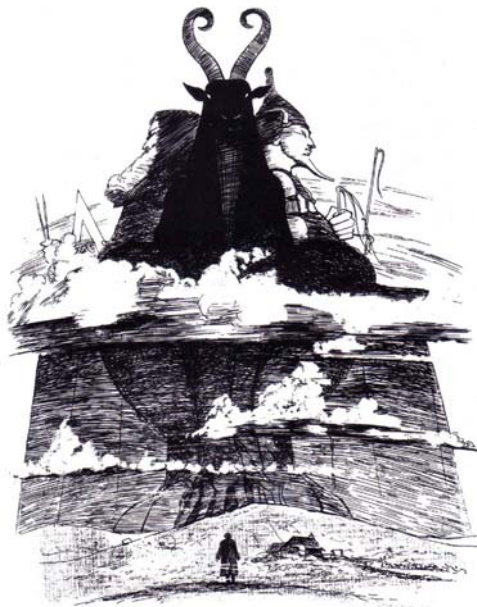
Figura 8: Quadro Vol. 1 (MOORE; CAMPBELL, 2005a, p. 54)

Ao considerar o tempo de alucinação do personagem, utilizo a citação de McCloud ao afirmar que “(...) a forma do quadro pode influenciar nossa percepção do tempo”, e passar a impressão de maior duração do evento (MCCLLOUD, 2005, p. 101). Neste caso, o quadro utiliza uma página inteira e o leitor imagina o tempo que durou o delírio do personagem, tamanha a quantidade de informações em uma única ilustração.