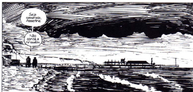
Figura 1: Quadro Vol. 1 (MOORE; CAMPBELL, 2005a, p.7)

Observo a presença de muitos riscos para compor a imagem (Figura 1). O autor também utiliza quadros de tamanhos variados para narrar a trama. Isto se deve ao ritmo de leitura, que varia de acordo com a quantidade de elementos dispostos dentro de um quadro. Will Eisner afirma que “quando estamos expostos a uma frequência de quadros de tamanho igual e, de repente, temos um quadro maior, este permite que o leitor faça uma breve pausa ao diminuir o ritmo da leitura” (EISNER, 1999, p. 36).