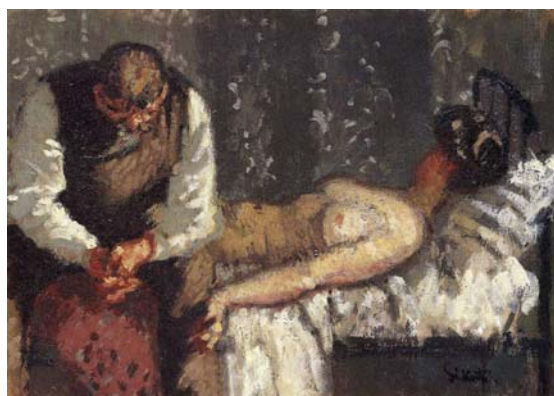
Figura 7: “The Camden Town Murder”, de Walter Richard Sickert, 1908

Aposto aqui a teoria da escritora americana de livros policiais Patricia Cornwell, que indica em seu livro chamado “Retrato de um Assassino – Jack o Estripador – Caso Encerrado” que os assassinatos em 1888 foram realizados por Walter Sickert, o pintor impressionista alemão que Alan Moore retrata nas páginas aqui analisadas. Moore não utiliza de tais dados para a realização de sua obra, mas, acrescenta detalhes interessantes sobre os hábitos do pintor, assim como uso da echarpe vermelha em seus retratos sombrios. Veja-se um exemplo da pintura do artista por meio da figura abaixo: