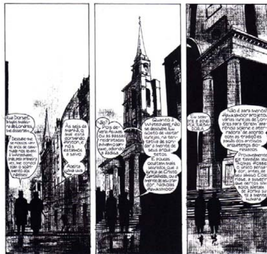
Figura 14: Sequência Vol. 1 (op. cit. p. 41)

Analiso o uso de uma sequência com quadros estreitos e altos ao apresentar igrejas de Londres (Figura 14). Tais construções apresentam caráter solene e aterrador, pois utilizavam alturas exorbitantes para acentuar seu significado monumental e o poder que representavam. O espaço entre os quadros ou, como afirma McCloud, sarjeta, “é responsável por grande parte da magia e mistério que existem na essência dos quadrinhos. É aqui, no limbo da sarjeta, que a imaginação humana capta duas imagens distintas e as transforma em uma única ideia” (MCCLOUD, 2005, p. 66).