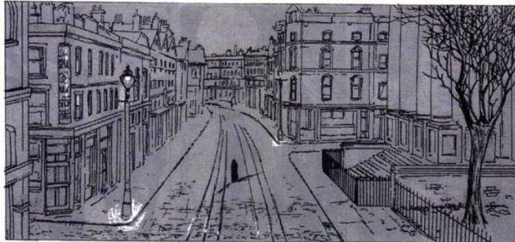
Figura 6: Quadro Vol. 2 (op. cit. p. 119)

[...] cinza extrai seu simbolismo do fato de ser, por excelência, um valor residual: aquilo que resta após a extinção do fogo e, portanto, antropocentricamente, o cadáver, resíduo do corpo depois que nele se extinguiu o fogo da vida (CHEVALIER, 1991, p. 247).