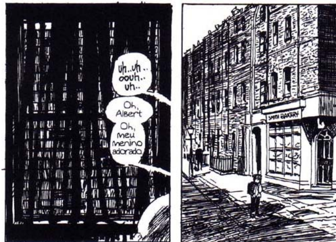
Figura 13: Quadro Vol. 1 (MOORE; CAMPBELL, 2005a, p. 17)

A primeira página do capítulo sete, Volume 2, apresenta vários quadros aleatórios, sem seguirem ordem cronológica na cena. Estes quadros antecedem momentos que vão ocorrer no decorrer da narrativa, ao repetir o mesmo quadro em sequência posterior.