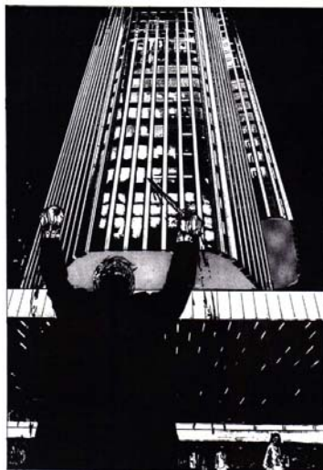
Figura 9: Quadro Vol. 2 (MOORE; CAMPBELL, 2005b, p. 112)

apêndice da GN, onde o autor, Alan Moore, faz comentários sobre os capítulos e os dados utilizados em suas páginas. Na cena em questão, ele afirma que esta ocorre na Áustria, e o leitor desatento só vai desvendar a conexão com o que Moore deseja nesta leitura, quando o próprio autor afirmar no final de “Do Inferno”: “A razão para a cena apresentada aqui é a coincidência cronológica algo eloqüente que vincula o início dos assassinatos de Whitechapel com a concepção de Adolf Hitler” (MOORE; CAMPBELL, 2005a, p. 186).