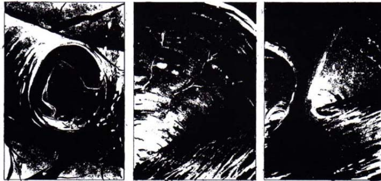
Figura 12: Sequência Vol. 3 (op. cit. p.76)

A sequência apresentada na Figura 12 mostra detalhes do delito em foco, ao direcionar o olhar do leitor em partes específicas do corpo da vítima. Há muito sangue nos quadros que antecedem esta sequência, na qual o leitor apenas imagina o que o assassino está cortando, pois não consegue identificar. É como se William se descontrolasse e, num impulso, começasse a cortar ainda mais a pobre mulher. São vinhetas bastante impressionantes, e seu uso é explicado por McCloud: “A ideia de que uma figura pode evocar uma resposta emocional ou sensual no espectador é vital nos quadrinhos” (MCCLLOUD, 2005, p. 121). Além disto, a interpretação dos quadros convencionalmente altera de leitor para leitor. “Os quadrinhos que eu ‘vejo’ na minha mente nunca vão ser vistos de forma idêntica por outra pessoa” (id. p. 196).