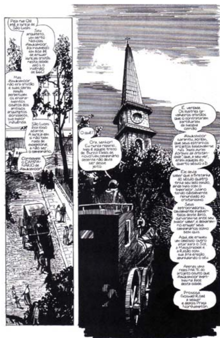
Figura 18: Vol. Volume 1 (op. cit. p. 95)

Outra estratégia visual é utilizada quando William e Netley, ao continuar o passeio pela cidade de Londres, acompanham a complexidade das suas construções.