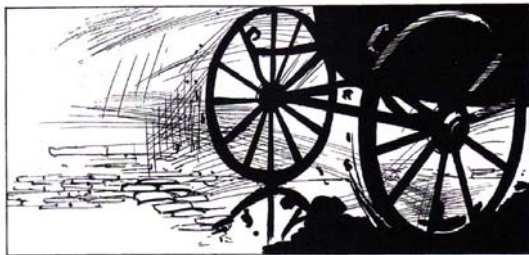
Figura 16: Quadro Vol. 1 (op. cit. p. 84)