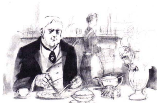
Figura 3: Quadro Vol. 1 (op. cit. p. 130)

Os quadros alternam entre o escuro e o claro. Quadros pretos no branco, outros branco no preto, de traços marcantes a rabiscos. Existem ainda quadros sem requadro, ou seja, sem a moldura do quadrinho, que são utilizados na sequência em que Jack, o Estripador, se prepara para agir, como apresento na Figura 3.