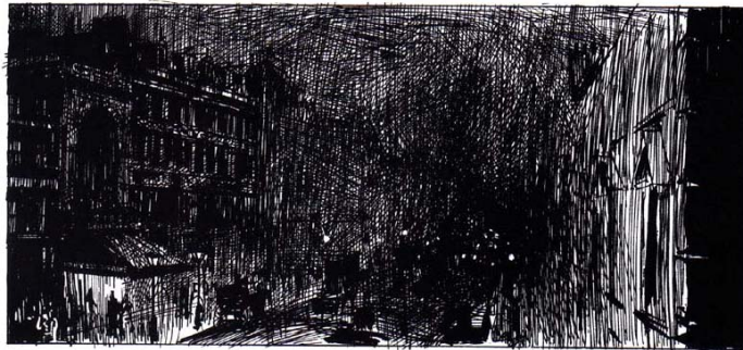
Figura 2: Quadro Vol.1 (op.cit. p. 72)

Em meio aos traços rabiscados, surgem desenhos esfumados, ao alterar o tipo de linha utilizada nas vinhetas mostradas anteriormente. Segundo Donis A. Dondis,