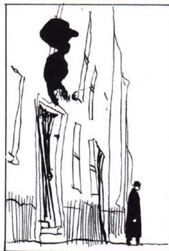
Figura 5: Quadro Vol. 2 (op.cit.p. 36)

Tal imagem contrasta com a apresentada na Figura 5, na qual a mesma não tem desenho definido, são alguns traços que representam uma construção.