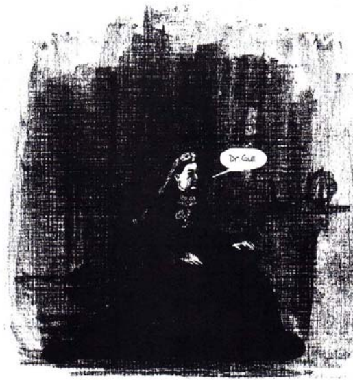
Figura 15: Quadro Vol. 1 (op. cit. p. 46)

Aponto outro quadro que ocupa mais da metade da página (Figura 15). Este quadro também se destaca pela falta de um quadro definido, o requadro. Nele está inserida a majestade britânica, como iconicamente reconhecida, e iniciam-se diversos quadros só com a imagem da Rainha Vitória ao dialogar com Dr. William Gull, sem que ele apareça ao lado dela. Dr. Gull é nomeado Médico Real Extraordinário. “A ausência de requadro expressa espaço ilimitado. Tem o efeito de abranger o que não está visível, mas que tem existência reconhecida” (EISNER, 1999, p. 45). Além disto, o autor indica que a ausência do requadro faz com que o leitor complete o cenário.