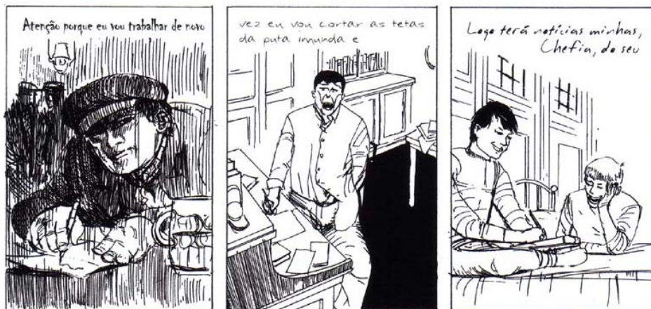
Figura 10: Sequência Vol. 3 (MOORE; CAMPBELL, 2003, p. 40)

Existem outras pessoas na cidade que se passam por Jack, o Estripador, ao escreverem cartas para a polícia. Estas cartas são apresentadas com a ilustração dos personagens ao escreverem suas cartas, com uma caligrafia diferente em cada quadro, para destacar a divergência entre elas (Figura 10). Um aspecto interessante é que o autor não inseriu o texto dentro de um balão. Conforme Eisner (1999), o balão é uma ferramenta que colabora para a avaliação do tempo. Neste caso, o quadrinho expressa a ideia de algo contínuo que está acontecendo, sem que a determinada ação termine no requadro.