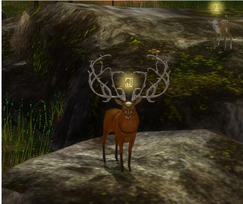
Figura 3. Cena do jogo The Endless Forest.