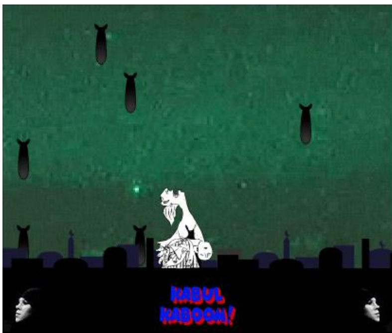
Figura 4. Jogo Kabul Kaboom!

Os jogos políticos envolvem temas que possibilitam uma reflexão por parte dos jogadores, principalmente por ter como centro assuntos que remetem à questões globais, como pode ser observado nos jogos “September 12th” e “Kabul Kaboom!”. Esse último traz como assunto os bombardeios realizados pelos Estados Unidos contra o Afeganistão (Figura 4).