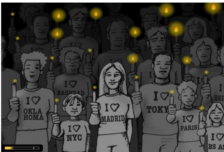
Figura 1. Interface do jogo Madrid.

Deste modo, um botão dentro de um jogo funciona como uma interface de entrada, que ao ser ativado, assimila a ação do jogador e gera uma resposta programada, que é mostrada na tela como uma interface de saída. Como por exemplo no newsgame “Madrid”, que remete ao atentado ocorrido em Madri no dia 11 de março de 2004 (Figura 1).