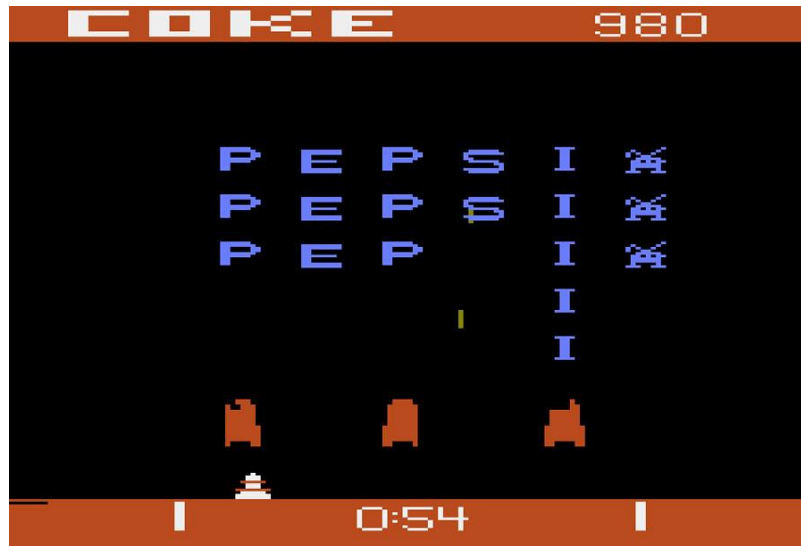
Figura 2. Tela de jogo desenvolvido pela Atari.