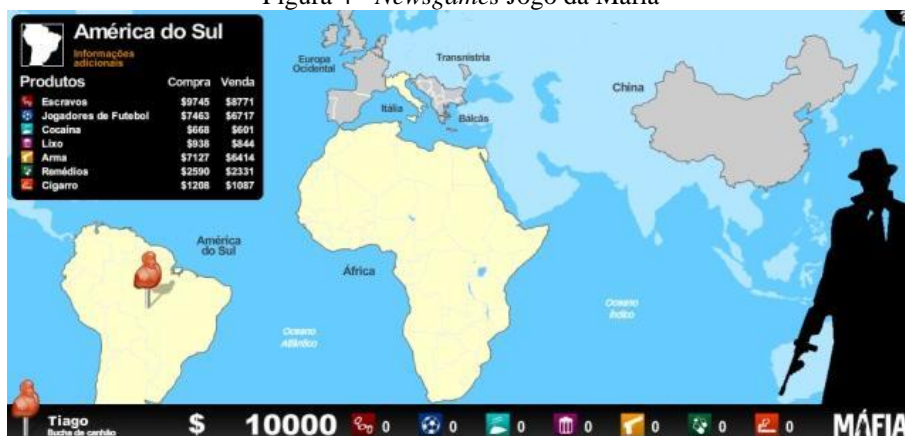
Figura 4 - Newsgames Jogo da Máfia

Outros exemplos de newsgames produzidos no Brasil é o Jogo da Máfia, criado em 2009, que aborda como a máfia atuava nos continentes, exibido na Figura 4.