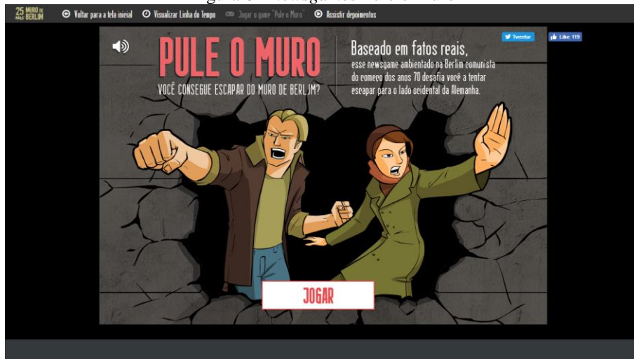
Figura 6 - Newsgames Pule o Muro

Em 2014, a Revista Galileu lançou o jogo Pule o Muro, demonstrado na Figura 6, em comemoração aos 25 anos de queda do Muro de Berlin e que conta ainda com uma linha do tempo e vídeo reportagem sobre o período.