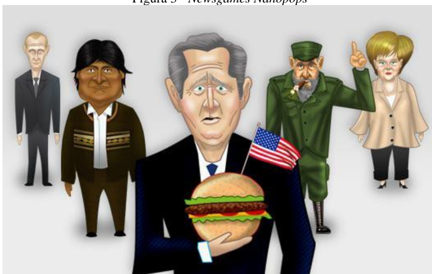
Figura 3 - Newsgames Nanopops

No Brasil, os newsgames foram adotados somente em 2007, com o lançamento do jogo Nanopops pelo portal G1, demonstrado na Figura 3. A proposta era centrada no cenário político do período e seu objetivo era que o jogador reconhecesse os principais líderes mundiais da época. Atualmente, o jogo Nanopops está disponível na página do Globo Esporte e desafia os jogadores a lembrarem que foram os craques do Brasileirão 2018.