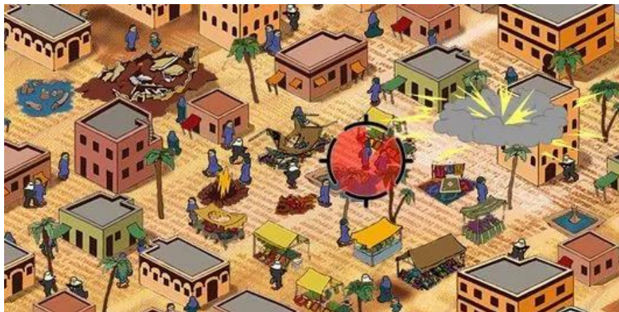
Figura 2 - Newsgames September 12th