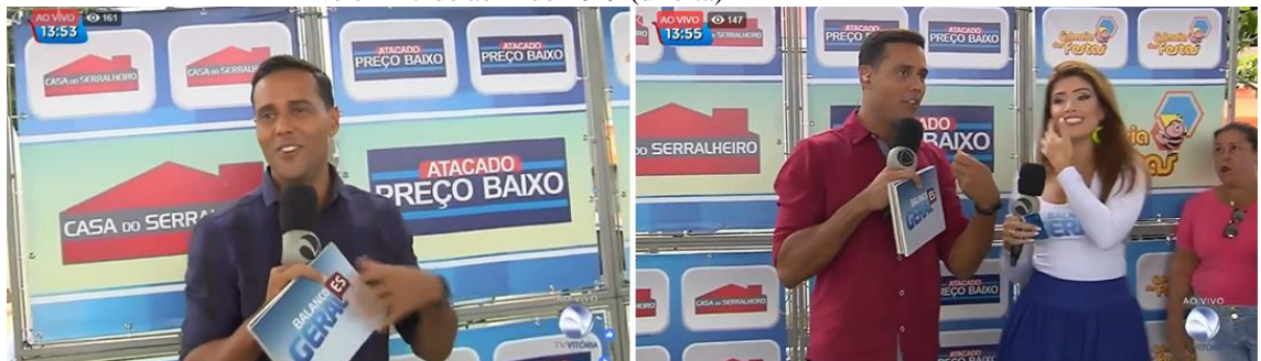
Figura 5 - Ação da Casa do Serralheiro e Atacado Preço Baixo em 16 de abril de 2019 (esquerda) e em 17 de abril de 2019 (direita)

Preço Baixo. O logo fica exposto em um backdrop banner , porém não são mencionados (figura 5).