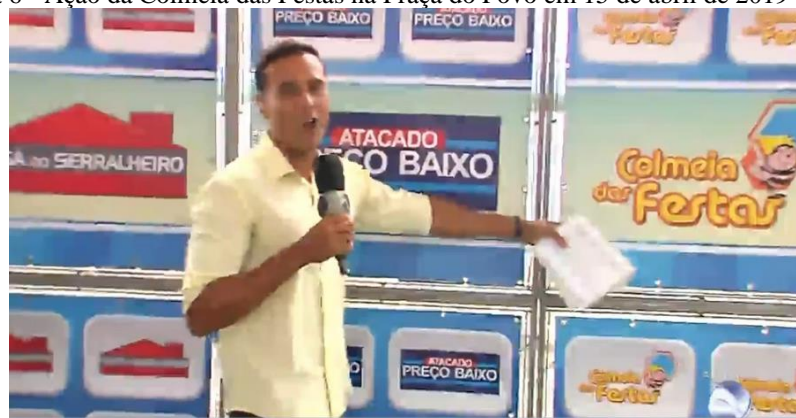
Figura 6 - Ação da Colmeia das Festas na Praça do Povo em 15 de abril de 2019