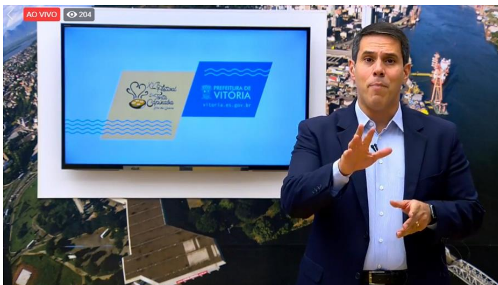
Figura 2 - Ação da Prefeitura de Vitória em 20 de abril de 2019