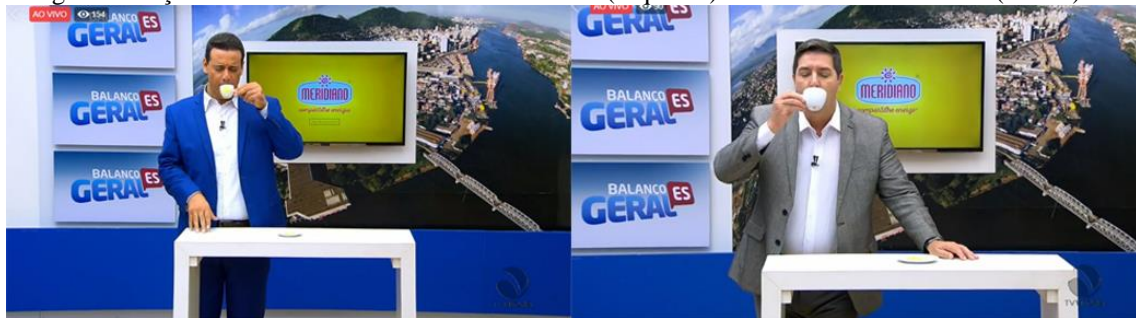
Figura 7 - Ação da Meridiano em 17 de abril de 2019 (esquerda) e em 18 de abril de 2019 (direita)