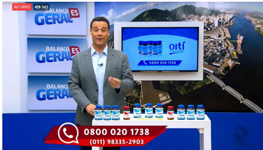
Figura 3 - Ação da Oití Suplementos em 20 de abril de 2019