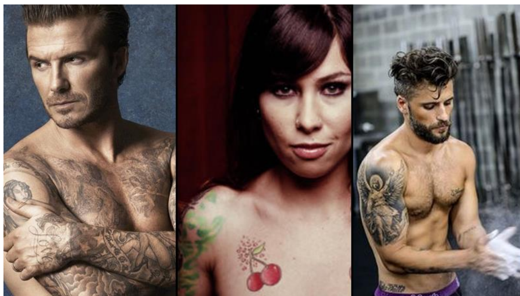
Figuras 2, 3 e 4: David Beckham, Pitty e Bruno Gagliasso

caso dela, pode-se também justificar pelo tipo de grupo social por quem Pitty é admirada; como cantora de rock, um movimento que se assemelha bastante ao punk no sentido de rebeldia e quebra dos padrões, é talvez mais fácil para que a celebridade se insira como tatuada e seja aceita e até admirada por essas escolhas de aparência.