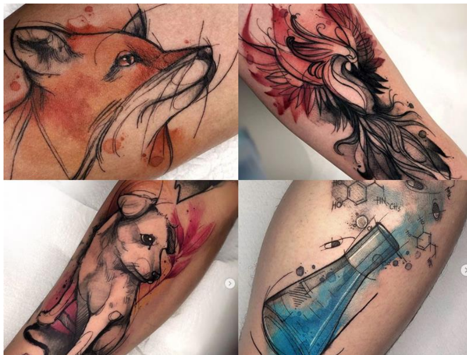
Figura 6: postagens da tatuadora Renata Henriques