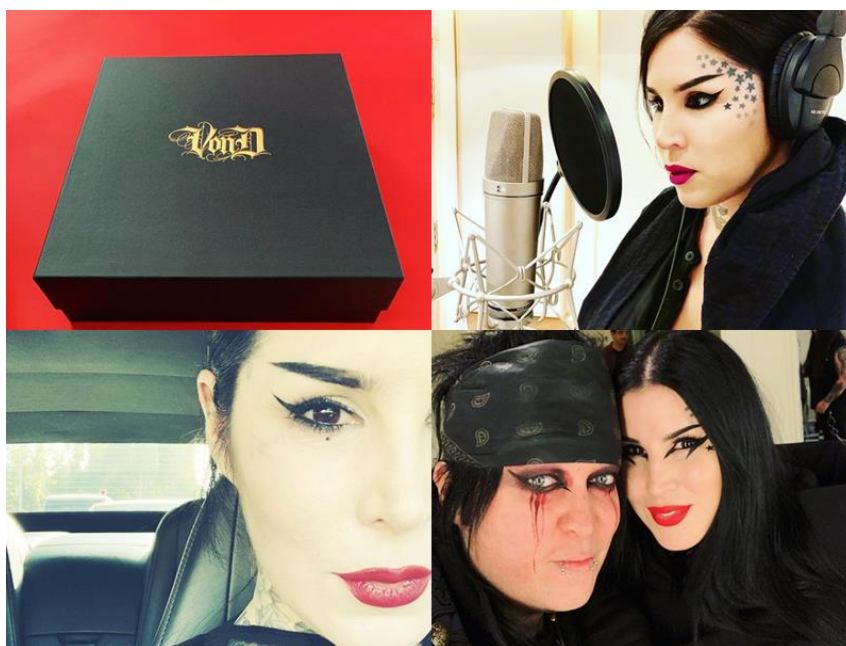
Figura 9: Postagens da tatuadora Kat Von D